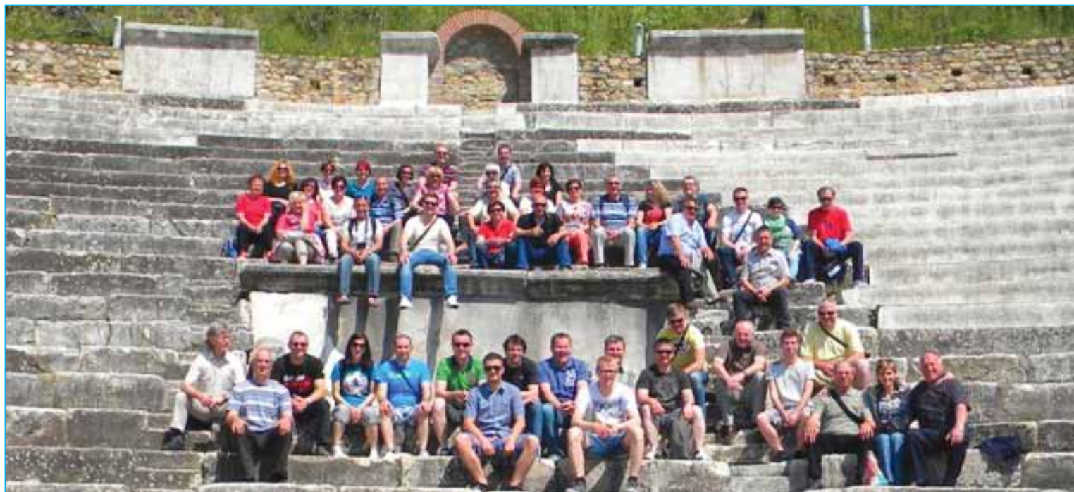
Člani društva smo si ogledali antično mesto Heraklea

Odločitev, da se sekcija Moški pevski zbor Kulturnega društva »Alojz Štrafela« Markovci odpravi na gostovanje v Makedonijo, je v društvu tlela že nekaj let. Ugotavljamo, da so za gostovanja