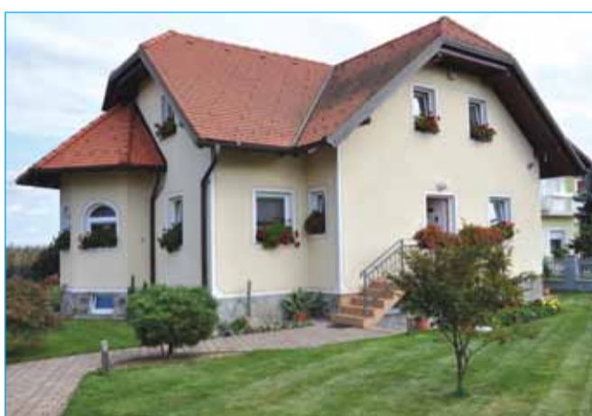
Družina Meglič, Prvenci 6 c