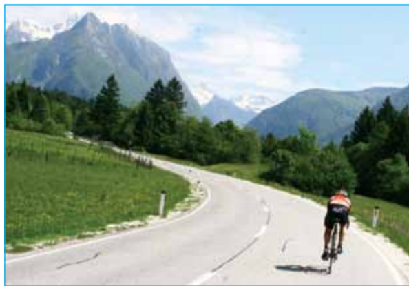
Panorama vožnje po Dolini Soče

Mitja Bezjak: »Res je, sedaj po končani dirki sem dobil informacije o tem, da je zares ogromno ljudi prebedelo noči ob računalniku. Tudi nekaj nervoze je bilo prisotne, ko na trenutke signal ni deloval. Takrat so vseskozi zvonili telefoni z vprašanji kje smo, kaj se dogaja, zakaj stoj-