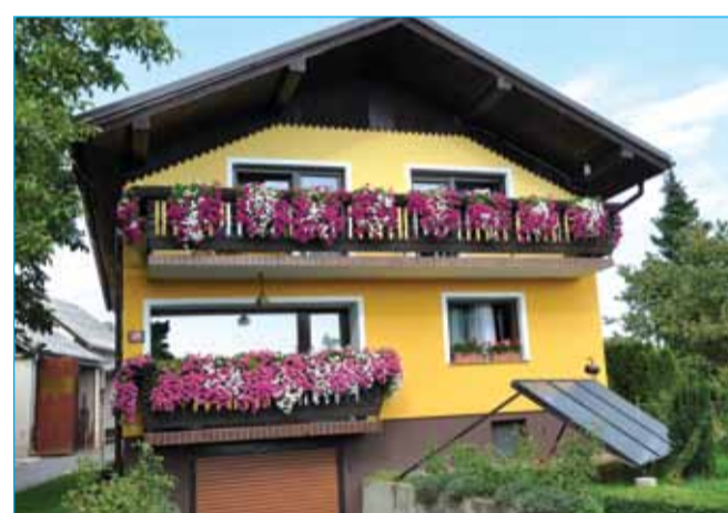
Družina Horvat, Zabovci 39