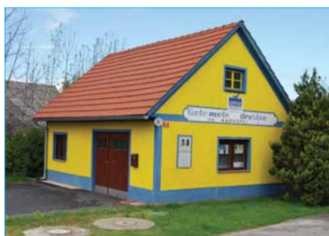
Najbolj urejen objekt Avto moto društvo Markovci