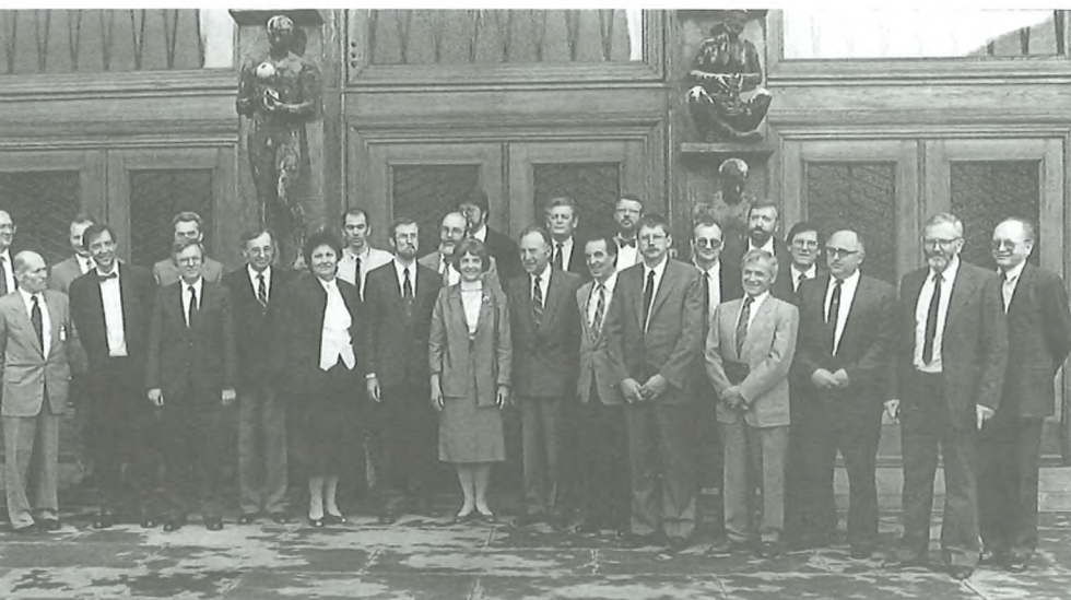
Izvršni svet skupščine RS – 'slovenska vlada', na dan imenovanja 16. maja 1990 pred vhodom v skupščino