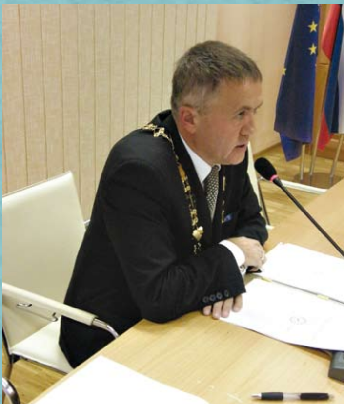
Intervju z županom V svojih predvolilnih napovedih so nekateri veliko govorili o investicijah, sedaj se seveda pričakuje realizacija in viri za te investicije