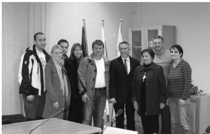
Nadzorni odbor – mandat 2010–2014