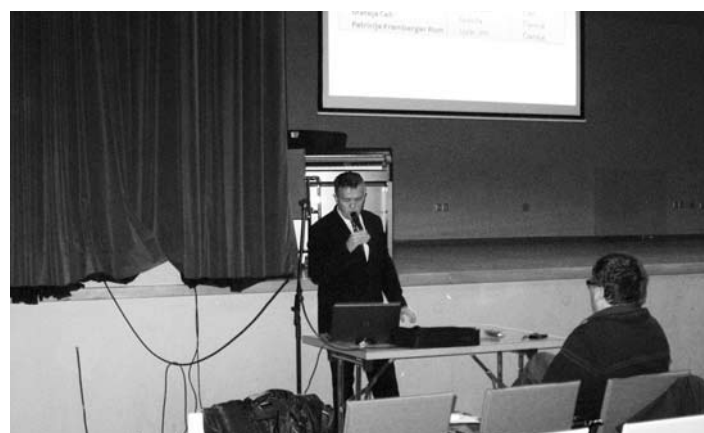
Na sestanku, ki ga je sklical župan, je ta novim članom v odborih in komisijah na kratko predstavil njihove naloge