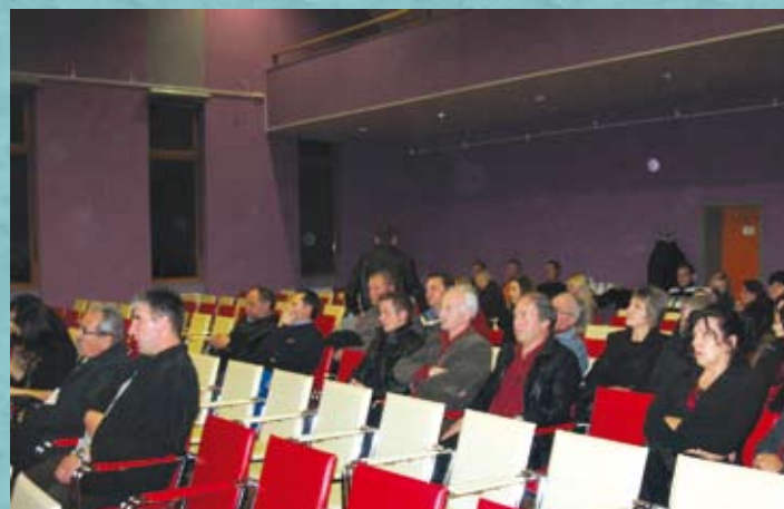
Novi člani med poslušanjem županove predstavitve