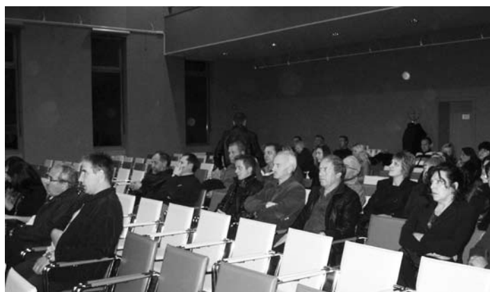
Novi člani med poslušanjem županove predstavitve