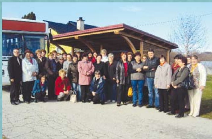
Društvo kmetič Destrnik Srečanje članic društev kmetič občin Spodnjega Podravja