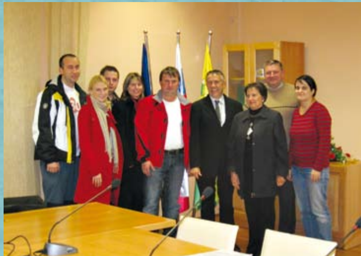
Nadzorni odbor – mandat 2010–2014