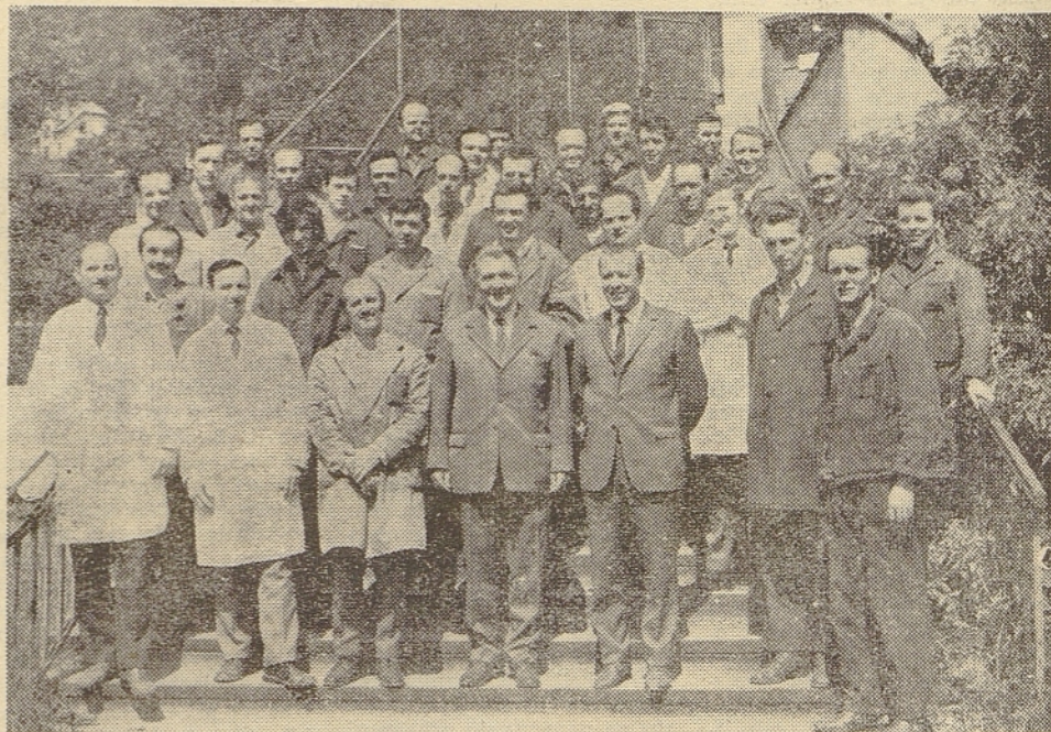
Iskrin pevski zbor, kakor ga je kamera zajela po drugi vaji, in ki je kasneje uspešno nastopil na proslavi dneva Iskre. Takrat je bilo dokaj navdušenja, dana so bila ugodna mnenja o dobrem in glasovno izenačenem zboru, ki naj bi tudi po proslavi nadaljeval z vajami in nastopal ob raznih priložnostih. Ta navdušenost je sedaj nekako utihnila (morda so krivi dopustil), nujno pa je, da pevski zbor dobi svoj odbor in da se določi stalnega dirigenta.

Občani, ki prosijo za posojilo, morajo biti kreditno sposobni in hkrati plačati 20% vrednosti posojila. Banke ne smejo prekoračiti predpisanih omejitev za posojila. Najvišji znesek posojila za industrijsko blago je 6000 din.