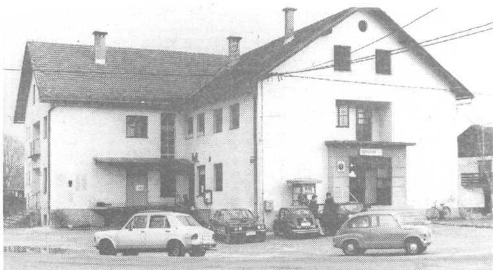
Zadružni dom so Barjani zgradili z udarniškim delom

Otroci, ki žive na območju Barja, se že kar lep čas vozijo v šolo na Galjevico. Rešitev očitno ni ravno najboljša, zato v kraju resno razmišljajo, da bi spet ustanovili lastno šolo. Ogrevajo se za štirirazrednico, ki naj bi jo uredili v prostorih