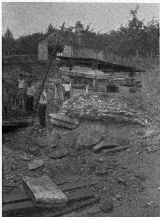
Sl. 5. Pogled na izkopavanje v Šempetru