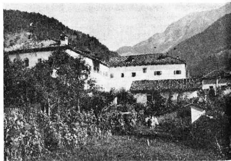
Kolonija »Sloka« v Paularu.

Solsko ministrstvo je izdalo navodila šolskim oblastem glede razdelitve trimestrov in šolskih počitnic. Prvi trimester se bo zaključil 23. decembra pred božičnimi počitnicami.