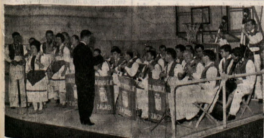
Folklorni ansambel «Tamburica» iz Zagreba, ki je prejšnji teden nastopil v Ljudskem domu v Krtžu, v