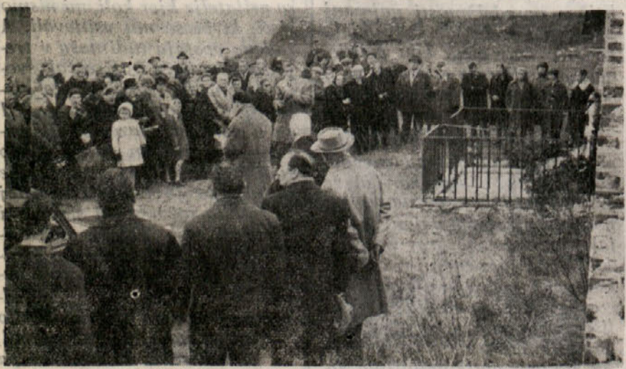
Slovenski in italijanski antifašisti s Tržaškega se za obletnico ustrelitve Pinka Tomažiča in tovarišev radi zbirajo na openskem strelišču. Žal, je kraj, na katerem so bili mučeniki ustreljeni, silno zanemarjen in napol razdejan. Le skromna kamnita plošča in pred njo ograjena gredica spominjata na junaške žrtve. Oblastem ni do tega, da bi izkazale dolžno čast junaškim protifašističnim borcem. (Gornja slika je bila posneta med komemoracijo leta 1962)

OPOMBA — Ta sestavek je sodeč po ustnih virih, napisal Tomažič in ga objavil v ciklostiliranem glasilu «Plamen».