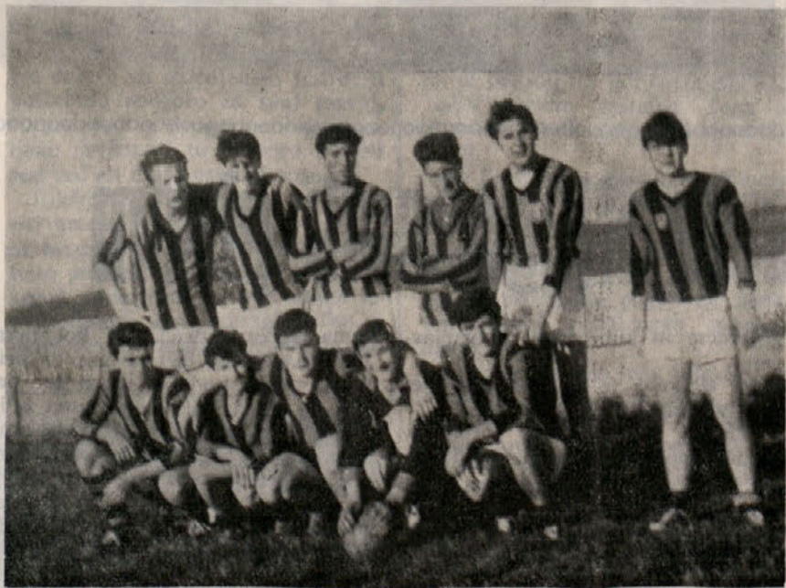
MLADI NOGOMETSI IZ SALEZA

V nedeljo, 15. decembra bodo naslednje tekme za pokal 42. obletnice ustanovitve Zveze komunistične mladine: