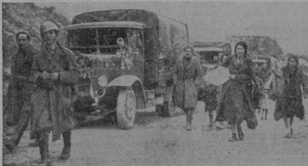
Zmagovite španske nacionaliste pozdravlja in spremlja rdečega nasilja rešeno prebivalstvo.

V. stopnje. Ker si je s svojim delom pridobil velike zasluge in ugled, je bil kremenit narodnjak in vedno dober Slovenec, ki nikdar ni zatajil svojega prepričanja. Na njegovi zadnji poti ga je spremljala ogromna množica ljudi. Zadnje slovo mu je izrekel g. župnik Jožef Bezjak v imenu vse župnije. Orisal je pokojnikovo življenje, ki je bilo polno preizkušenj, pokazal je njegove