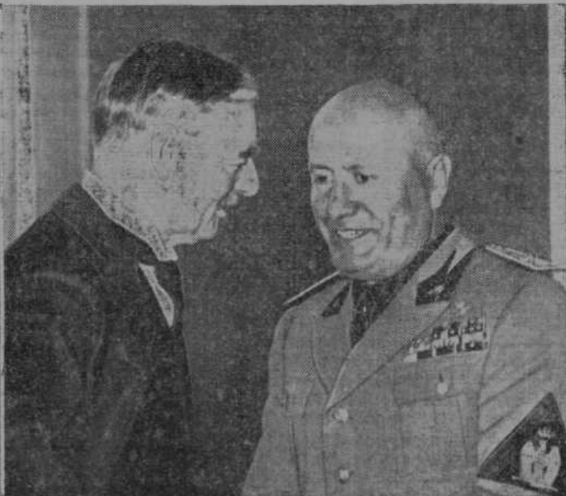
32.000 tonska angleška vojna ladja »Repulse«, katera bo popeljala na spomlad angleški kraljevski par na obisk v Kanado in v Združene države Severne Amerike. — Desno: Mussolini in angleški ministrski predsednik Chamberlain v razgovoru v Rimu.