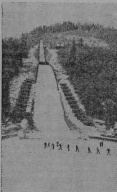
Svetovno tekmovanje za prvenstvo v smučarskih skokih bo letos od 11. do 12. februarja v Zakopanah na Poljskem. Na sliki vidimo zakopansko skakalnico.