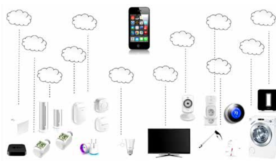
Slika 1 : Nadzor pametnih naprav s pomočjo pametnega terminala in oblaka (povzeto po: https://www.youtube.com/watch?v=DYB2OY4jXnA )

Drugo obliko izvedbe pametnega doma so uporabili programerji, združeni v skupnost OpenHAB (angl. Open Home Automation Bus). OpenHAB je odprtokodna, tehnološko neodvisna platforma za avtomatizacijo doma, ki deluje kot središče pametnega doma. Nekatere prednosti platforme so: