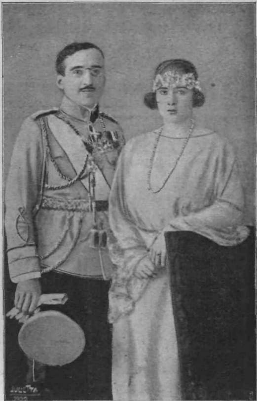
Kralj Aleksander I. — Kraljica Marija.