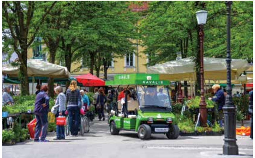
Slika 2: Osrednja ljubljanska tržnica je odprta skozi celo leto, razen ob nedeljah in praznikih.

K biotski raznovrstnosti pomembno prispevajo čebele, saj se je v mestu ohranilo tako imenovano urbano čebelarjenje. Formalno ga omejuje avtocestni obroč, znotraj katerega lahko naštejemo več kot 200 čebeljih panjev, v katerih živi do 40 milijonov čebel. Razdalje med panji so majhne in rekli bi lahko, da skupaj predstavljajo en velik čebeljak. Ljubljana se ponaša tudi s svojim čebeljakom, ki stoji v Botaničnem vrtu Univerze v Ljubljani, lansko leto pa smo na