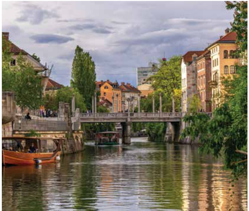
Slika 3: Čevljarski most je zasnoval arhitekt Jože Plečnik.