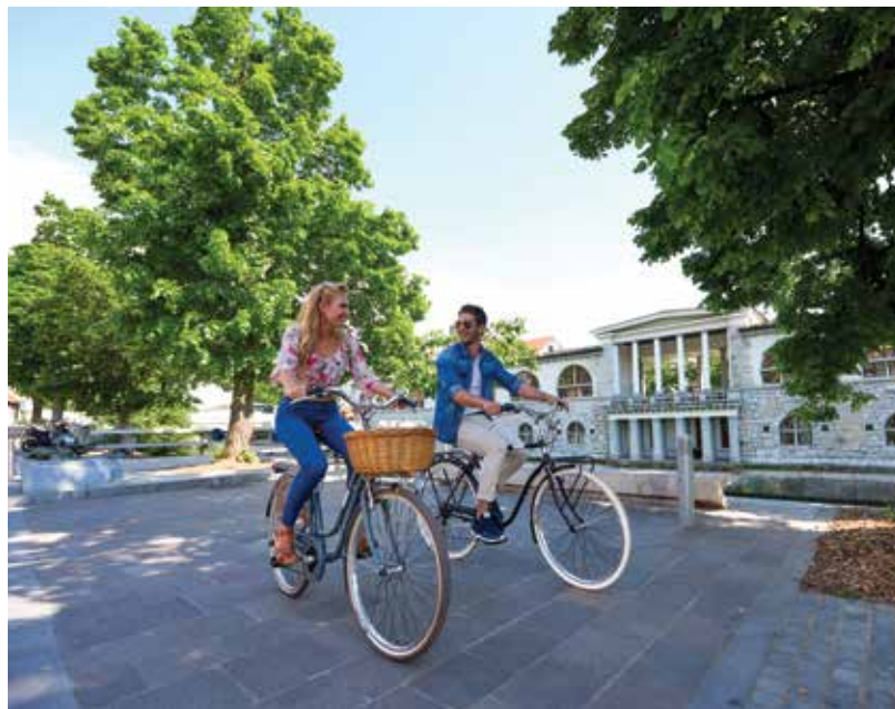
Slika 1: Petkovškovo nabrežje spada v območje mestne peš cone.

V zadnjem obdobju tudi ostali načini mobilnosti v mestu prehajajo na bolj trajnosten način delovanja. Tak primer je Kavalir , vozilo na električni pogon, ki ga kdorkoli lahko pokliče kadarkoli in se z njim brezplačno zapelje z ene točke do druge; prilagojeno je tudi gibalno oviranim osebam. Okolju prijazen je tudi električni turistični vlakec Urban , ki obiskovalce popelje po turistični krožni poti. Deluje po sistemu hop on-hop off in vključuje 10 lokacij. Nenazadnje so pomembne korake v smeri trajnostnega razvoja naredili v javnem podjetju Ljubljanski potniški promet (LPP). Mestni avtobusi postajajo vse bolj priljubljen način prevoza, k čemur nedvomno prispeva tudi dejstvo, da ima kar 95 % meščanov najbližje postajališče za mestni potniški promet oddaljeno manj kot 500 m. Vsi mestni avtobusi