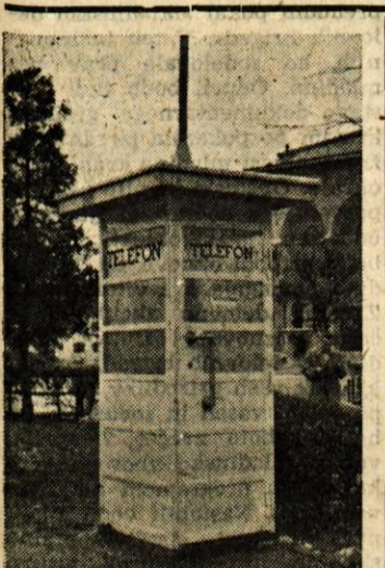
NOVA PRIDOBITEV V KRANJU

V »Parku Svobode« montirajo javno telefonsko govornico