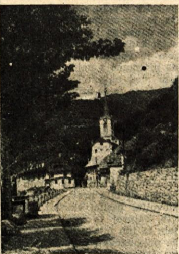
Tržič, Cankarjeva cesta

Občinski ljudski odbor je imel lani vseh dohodkov 138 milijonov 693.000 dinarjev, torej 105% planiranega zneska. Do 31. 12. lanskega leta je porabil za proračunske investicije, za sklad za pospeševanje kmetijstva, sklad za kreditiranje gradnje stanovanj, za sklad za kreditiranje gospodarskih investicij itd. 93.573.000 dinarjev. Ostalo