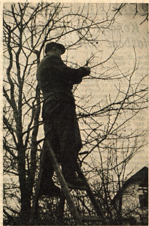
ZIMA SE JE KONČNO POSLOVILA ... Prvi so se pojavili umni sadjarji

S I. seje novo izvoljenega Sveta za turizem OLO Kranj