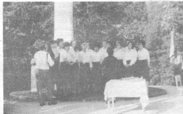
Po več letih premora se je sokrajanom predstavil tudi ženski pevski zbor KUD Brdo-Vrhovci