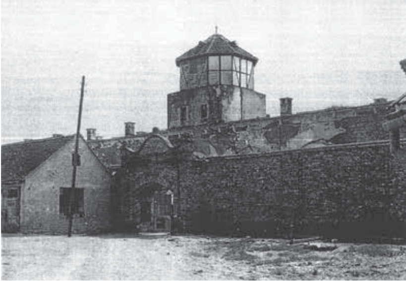
Vhod v taborišče Stara Gradiška.

Slovenci. V drugi knjigi piše, da so ob koncu leta 1943 uspeli pobegniti štirje naši sotrpini. 64