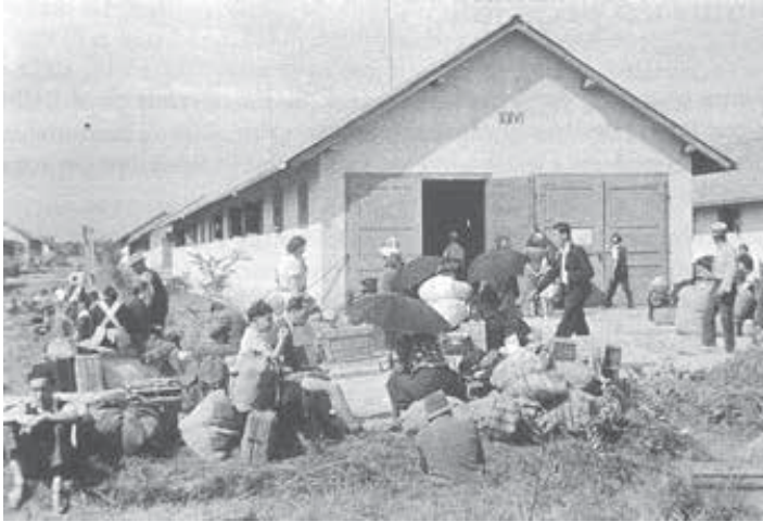
Slovenski izgnanci pred barako v Slavonski Požegi julija 1941.

in Srbe kot ustaše in drugo osebje taborišča, tako da je jasno, kako so se obroki razdeljevali.