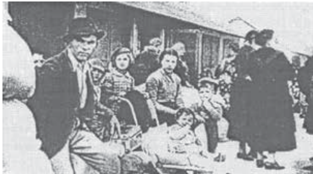
Prihod slovenskih izgnancev v Slavonsko Požego. Fotografija je iz knjige Spomini in pričevanja I , str. 419.

Še mnogo Slovencev je pobegnilo prek meje ali pa so se bili prisiljeni izseliti. Takih je bilo 17.000, kakor navajajo številni avtorji. Podatek je prevzet po poročilu s seje v nemškem poslanstvu v Zagrebu 22. septembra 1941, v katerem je navedeno, da je prej pobegnilo že 17.000 Slovencev. 15 Ve se, da naj bi bilo med njimi tudi 83 duhovnikov. 16