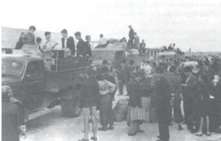
Odhod slovenskih izgnancev iz taborišča Slavonska Požega v Bosno. Fotografija je iz knjige Spomini in pričevanja II , str. 442.