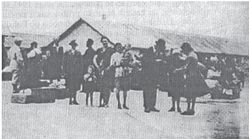
Slovenski izgnanci v ustaškem taborišču Slavonska Požega julija 1941.

Vselitveno-izselitveno taborišče Slavonska Požega je prenehalo delovati, kot je bilo že povedano, 22. oktobra 1941. Tako je obstajalo samo tri mesece in pol. Razpustili in administrativno likvidirali so ga 18. novembra 1941. 25