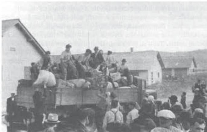
Odhod slovenskih izgnancev iz Slavonske Požega v Sanski Most julija 1941. Fotografija je iz knjige Spomini in pričevanja II , str. 442.

Razseljevanje Slovencev je potekalo z zamudo, saj domovi Srbov niso bili pravočasno izpraznjeni. Zato so z razseljevanjem Slovencev začeli komaj 17. julija. Takrat je bilo v taborišču že 3000 Slovencev in še precej Srbov. Razseljevanje je potekalo tako kot prikazuje tabela (priloga 8). Razlike v številu glede na transportni seznam in poročilo komandanta taborišča so majhne in razumljive, saj so, potem ko so sestavili transportni seznam, zbrisali ali dodali kakšno osebo. Transportni sezname za izselitev iz taborišča (t. i. odpravnica) so podrobno vsebovali vse podatke o transportiranih osebah: kdaj so rojene, kaj so po poklicu, od kod prihajajo (priloga 9).