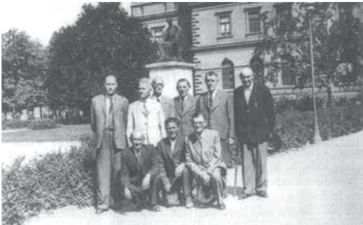
Zagrebski Slovenci in člani Rdečega križa pričakujejo izgnance v Zagrebu.