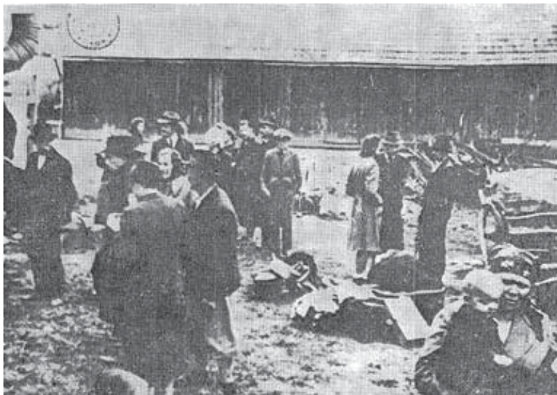
Slovenski izgnanci na železniški postaji v Slavonski Požegi. Fotografija je iz knjige Slobodana Miloševića Izbeglice i preseljenici na teritorij okupirane Jugoslavije 1941–1945 , str. 15.

je bilo julija pripeljanih več Slovencev, tako da taborišče ni moglo sprejeti enakega števila Srbov, saj do 1. avgusta 1941 iz taborišča ni odpeljal noben transport, s katerim bi prepeljali izgnane Srbe v Srbijo. Posledica je bila, da so morali Slovence razseljevati iz taborišča na hitrico in nenačrtno.