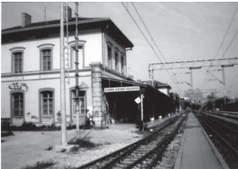
Železniška postaja Zapadni kolodvor v Zagrebu. Tu so za nekaj časa obstali vsi transporti na poti za Hrvaška, Bosno in Srbijo.