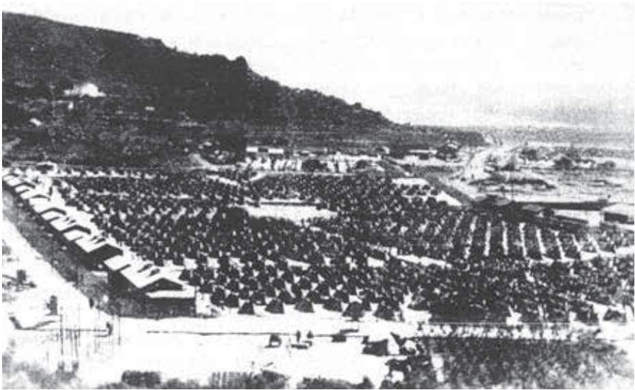
(14) Taborišče Kampor na otoku Rabu 1941–1943. Fotografija je iz knjige Miša Deverića in Ivana Fumića Hrvatska u logorima 1941.–1945. , str. 91.

Hrvate so pripeljali 6., 7., 9., 10. in 11. avgusta, 9. septembra, 20. in 31. oktobra 1942. Skupaj 2024 oseb. Ker je bila večina njih pripeljana iz Čabra, je mogoče predpostaviti, da so bili tudi med njimi Slovenci, saj je v Čabru in ob meji živelo precej Slovencev. Pomembno je tudi, da sta bila dva transporta internirancev pripeljana iz Italije, in sicer 26. 10. 1942 je bilo pripeljanih iz Padove 175 oseb, dan za tem pa iz Gonarsa 122 oseb. Tudi med temi interniranci so bili tako Slovenci kot Hrvati, ki so bili po okupaciji Slovenije izgnani v omenjeni italijanski taborišči.