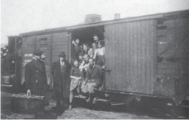
Izgnanci osmega transporta na Hrvaško. Fotografija je iz knjige Spomini in pričevanja II , str. 132.