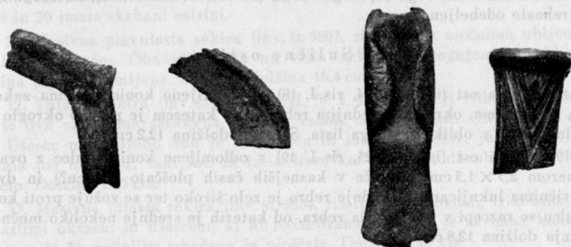
Sl. 1. Črmožiše

4. Srp (inv. št. 9836, ris. I, 4), polovica rezila je odlomljena; rezilo je široko in hrbet strehasto odebeljen; ročaj je obrobljen z visokima rebroma, med njima pa so štiri ozka, a na zunanji strani je četverooglat, lahko profiliran nastavek.