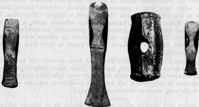
Sl. 4. Rogatec

fragmenti nakita ter posod. Po razvrstitvi H. Schmidta 11 pa moremo razdeliti črmožiške in cerovške srpe v dva tipa, v peschierske s prevladujočim navpičnim ročajem (1—11) in v švicarske, kjer se rezilo, in ročaj medsebojno prelivata drug v drugega (12—17). Pravilno imajo srpi na desnem zunanem robu, kjer prehaja ročaj v hrbet rezila, trioglat ali štirioglat nastavek, ki je rabil za boljšo pritrditev lesenega dela ročaja. Rezilo je večinoma ojačeno z enim ali dvema rebroma, ki se na koncu ročaja razcepita in ga ojačita na notranjem delu. Včasih je rezilo ojačeno samo s strehasto odebelitvijo hrbtna, ki se na koncu ročaja vilasto razčleni v rebra, na katerih so pogosto šibkejše ali krepkejše zareze z