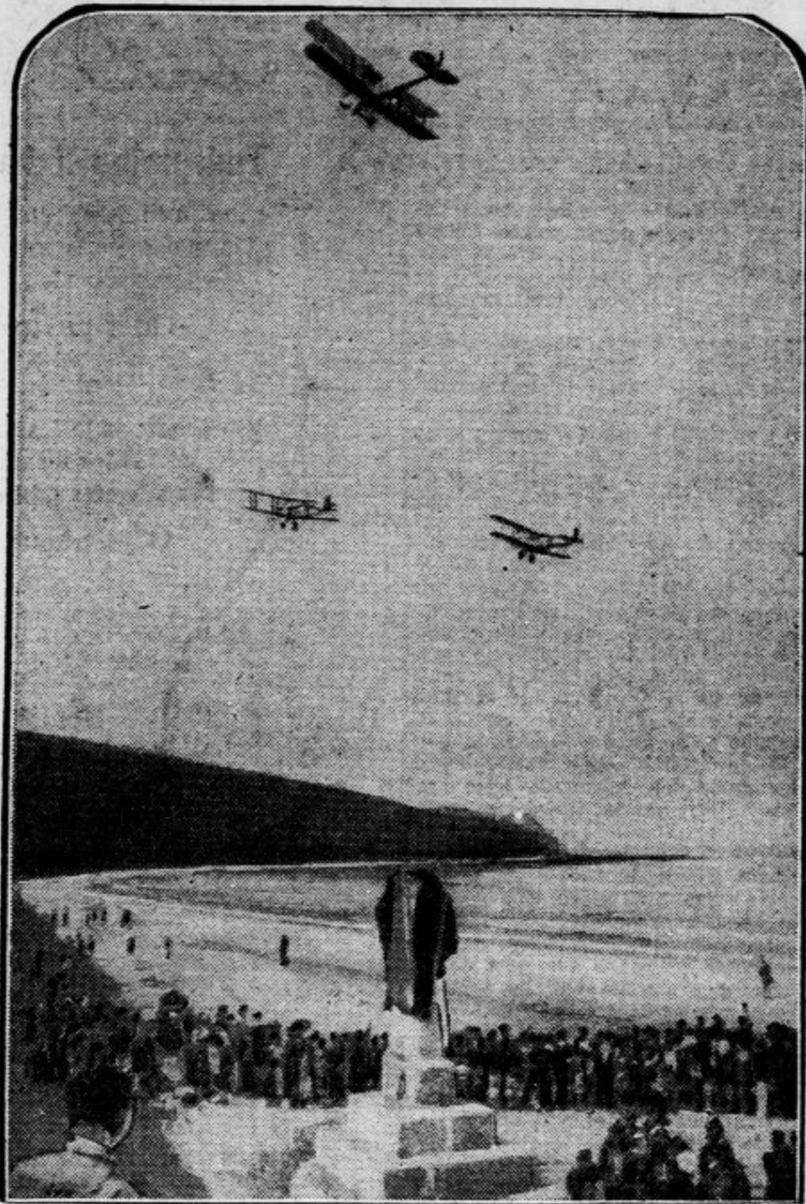
Tu je pristal »Rumeni ptič«

V Comillas-Santandru na Špankem so z velikimi svečanostmi odkrili spomenik na kraju, kjer je francosko letalo »Rumeni ptič« po srečnem preletu Atlantskega oceana prvič pristalo na evropskih tleh. Med odkritjem spomenika je krožilo v zraku brodovje španskih vojnih letal.