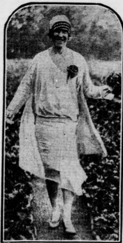
Kraljica med cveticami

Zavarovalnica Lloyd na Angleškem je uvedla novo, zelo privlačno vrsto zavarovanja, ki ima to prednost, da ne traja posebno dolgo. Gre za zavarovanje vseučilišnikov pri izpitih. V primeru, da dijak ne napravi skušnje, prejme pogodeno odškodnino, ki mu omogoči, da lahko študira naprej. Zavarovanec ima vsekakor tudi nekaj obveznosti: prvič mora točno plačevati premije, drugič mora redno obiskovati predavanja. Ustanova je vsekakor večjega moralnega kot gmojnega pomena.