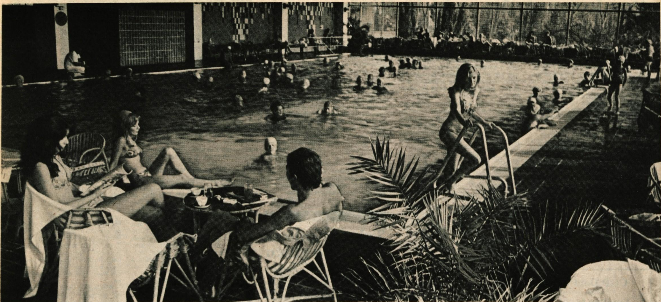
Pokriti bazen v portoroškem hotelu Palace