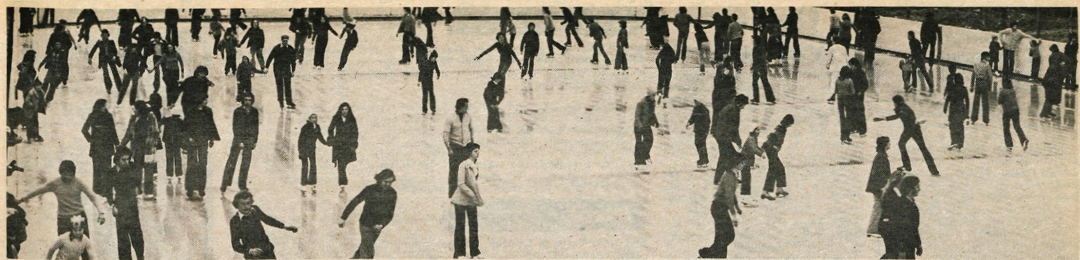
V petek smo s tihim upanjem, da se bo začela prava zima, objavili sliko in vest, da je blejsko jezero začelo zmrzovati. No z ledom kot kaže ne bo nič. Edina zimska rekreacija na Bledu je ta hip umetno drsališče. V petek so se na Bledu sestali tudi člani interesne skupnosti za izgradnjo rekreacijske in turistične infrastrukture Bleda. Razpravljali so o nadaljnji gradnji drsališča