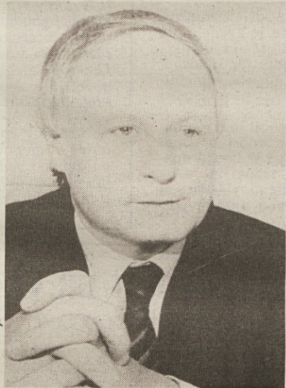
Arhivski posnetek Oskarja Lafontaine