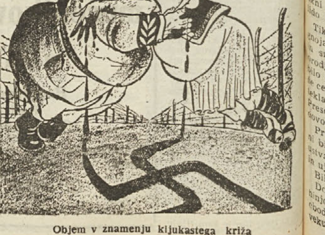
Objem v znamenju kljukastega križa