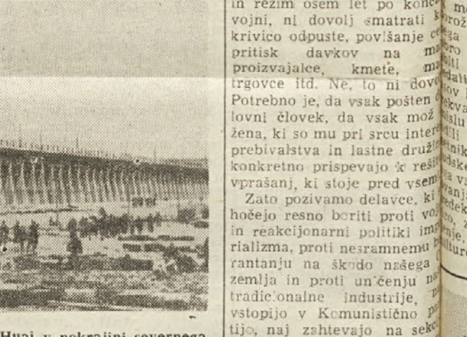
Veliki Jez Sanho Dam, ki je bil pred kratkim zgrajen na reki Huai v pokrajini severnega Kitajska.

Isto se je zgodilo na finančnem polju, kjer je država izenačila proračun, povečala vrednost juana, povečala realno plačo delovnih ljudi, znižala cene, zmanjšala administrativne stroške. Kitajska je danes država z veliko bodočnostjo, država, ki bo postala v kratkem časa izmed najbogatejših držav na svetu.