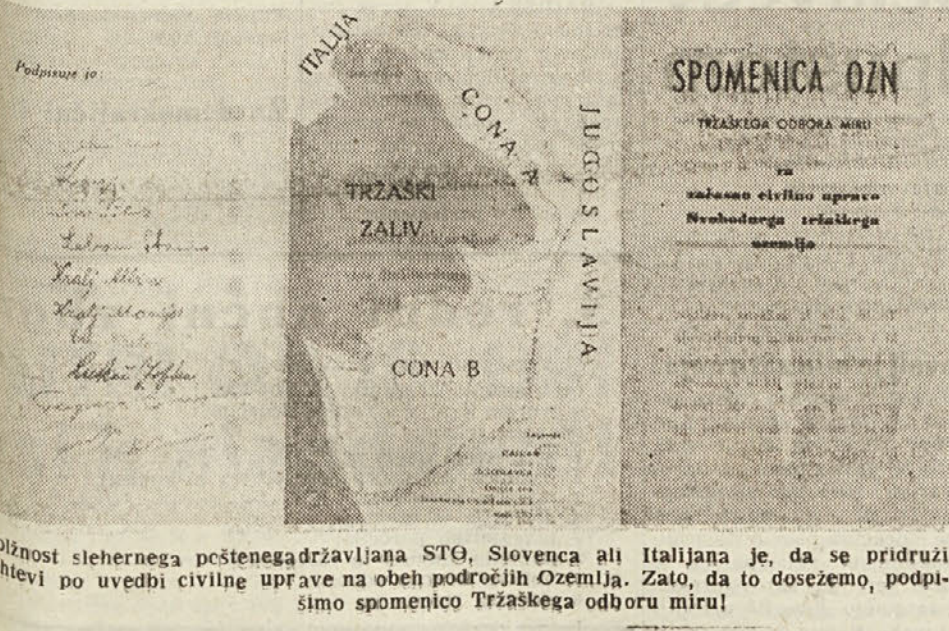
Obzornost stehernega peščenegadržavljana STG, Slovenca ali Italijana je, da se pridruži kmetjevi po uvedbi civilne uprave na obeh področjih Ozemlja. Zato, da to dosežemo, podpisimo spomenico Tržaskega odbora miru!