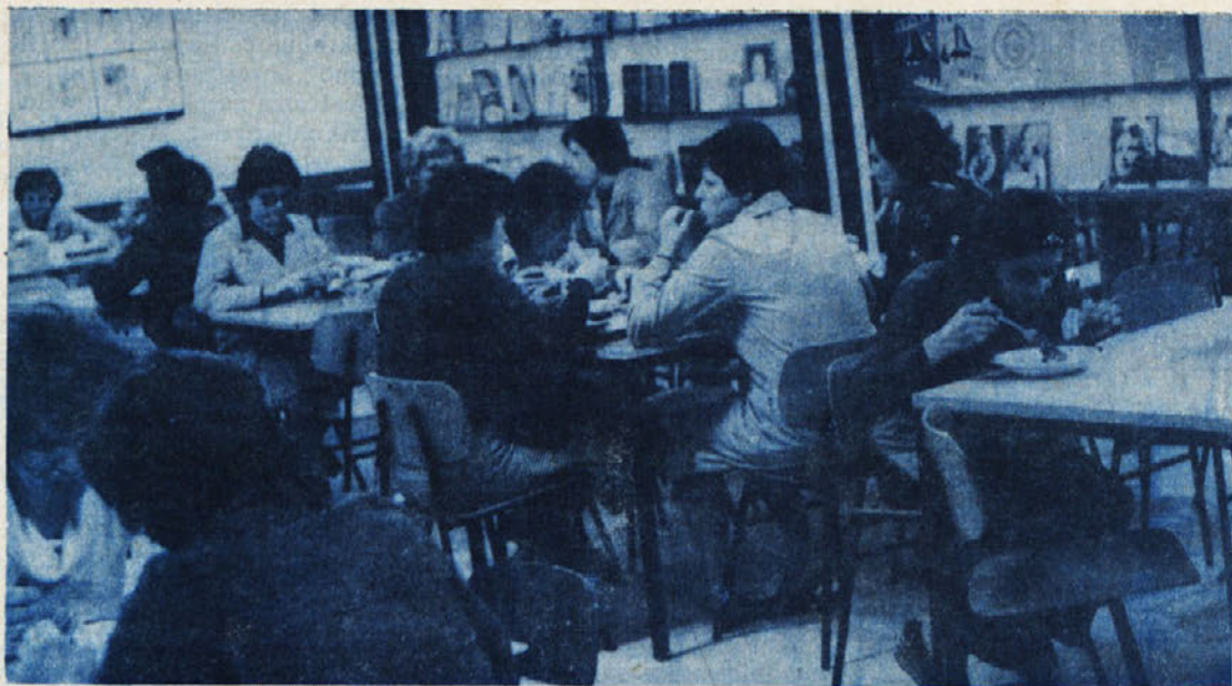
Ob prehodu tozd Ločna na eno izmeno, smo se v novomeškem delu Laboda dogovorili, da bomo malicali v štirih skupinah – tri so za delavke Ločne, ena od teh tudi za tozd Commerce – delavce iz skladišča ter zadnja za delavce v DSSS in del Commerca.