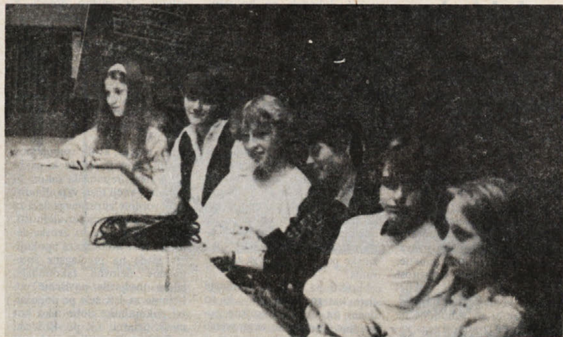
V tozd Libna je začelo z delom šest novih mladih delavk s končano dvo ali tri-letno konfekcijsko šolo. V uvodnem dnevu so se seznanile z organiziranostjo naše delovne organizacije – s programom dela, dejavnostmi nasploh, družbenopolitičnim delom in podobno.

Vzporedno s prizadevanji za pridobitev čim večjega števila