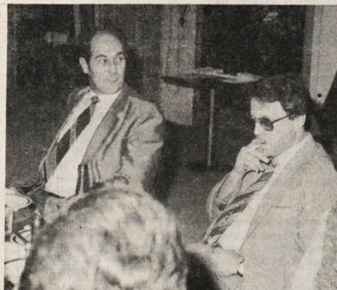
Ex tempora je letos prejel drugo nagrado.