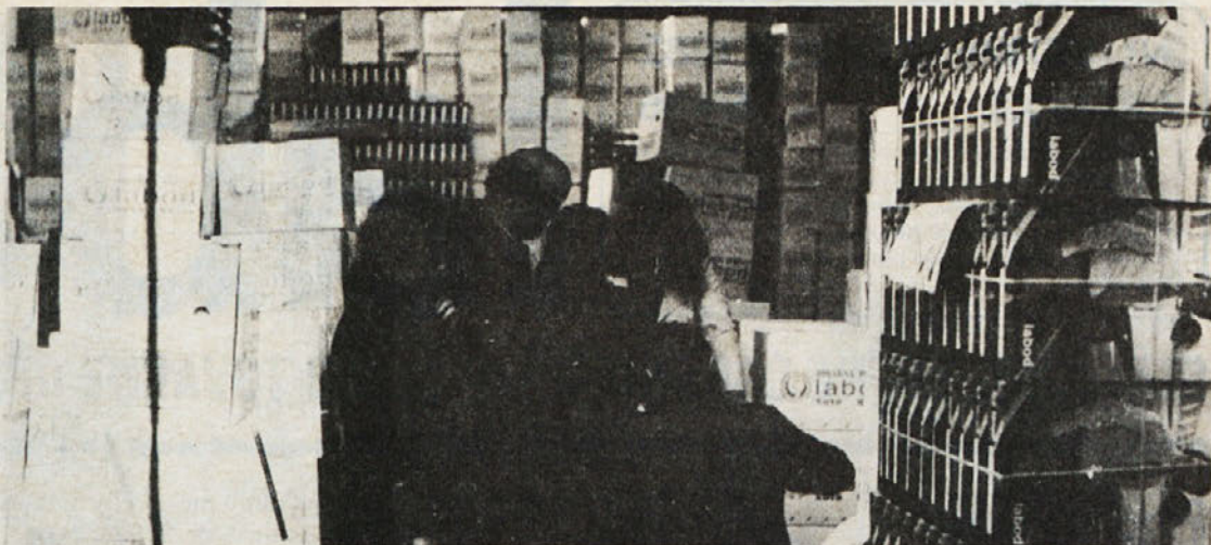
Za začetek nekaj inštrukcij tistim, ki dela v skladišču niso vajeni.

Za reševanje spornih razmerij je pristojno Sodišče združenega dela za podstanovska razmerja pa temeljno sodišče.