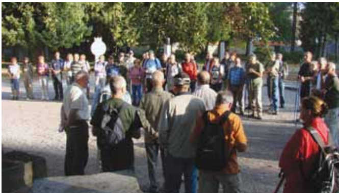
Nagovor pohodnikom pred pohodom v parku kulturnikov.

Sekretar OZVVS Ribnica je v nekaj stavkih opisal pomen parka kulturnikov, v katerem so dobili svoja obeležja vsi zaslužni možje, rojeni v ribniški dolini (skupaj 67), ki so v več stoletjih neizprosno branili duhovno in materialno podobo, imenovano Slovenec, in največ prispevali za splošen gospodarski, kulturni in umetniški razvoj naše družbe. Imena teh zaslužnih mož, pesnikov in pisateljev, likovnih in glasbenih umetnikov, zgodovinarjev in politikov, znanstvenikov, organizatorjev, narodnih buditeljev in mecenov so izpisana na 17 različnih kamnitih obeležjih v ribniškem gradu.