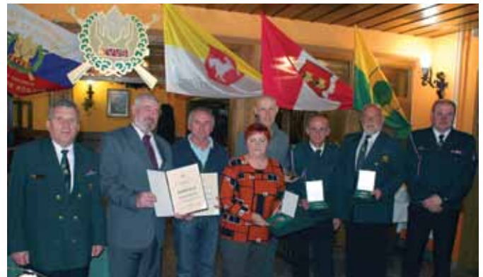
Prejemniki in podeljevalca plaket, zahval in tetraedra.