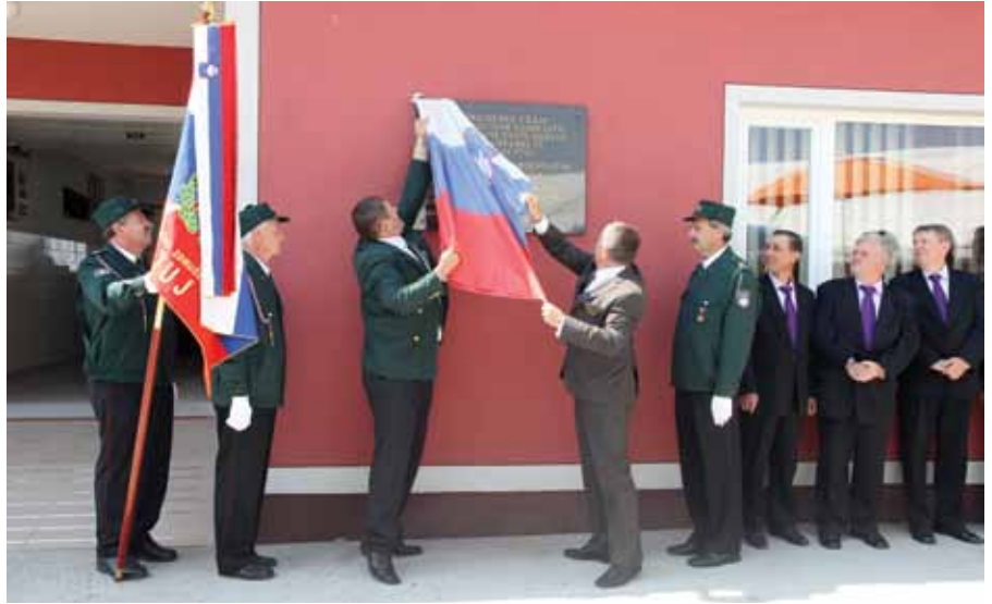
Odkritje obeležja na Destrniku

Na našem področju je bilo kar nekaj pomembnih dogodkov med osamosvojitveno vojno in med pripravami nanjo. Tako smo v ta namen postavili pet spominskih obeležij. Na upravni zgradbi Taluma Kidričevo je spominsko obeležje namenjeno tajnemu skladišču orožja; na pročelju Mestne hiše na Ptujju je spominsko obeležje Manevrski