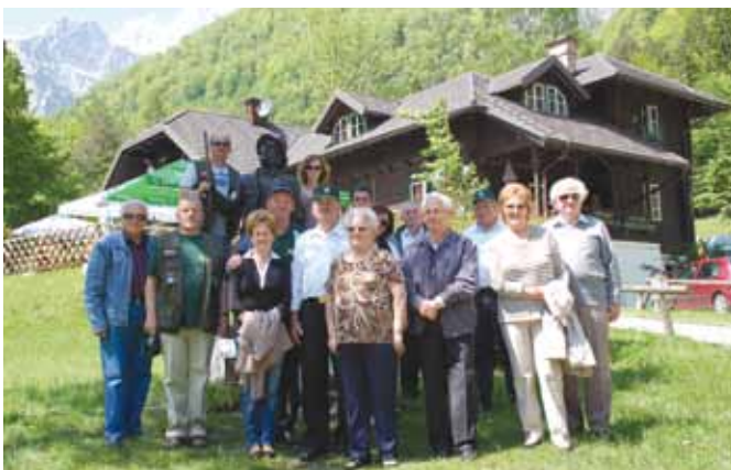
Konjiški veterani pri izviru Kamniške Bistrice.