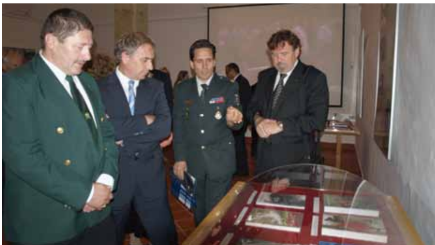
Razstava Vojna za Slovenijo 1991 v literaturi