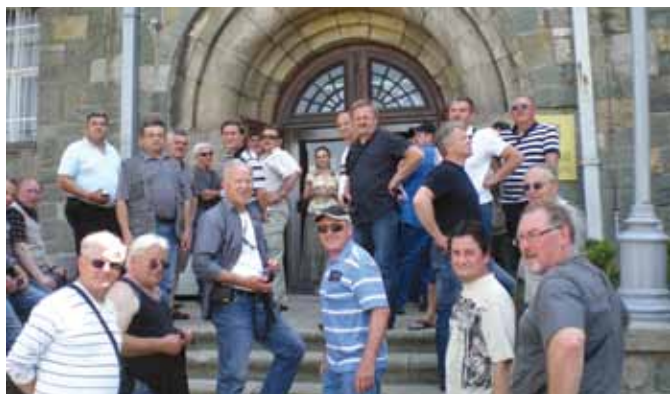
Udeleženci izleta pred muzejem.

pa je to velik park s skulpturami, z vojnim muzejem in gostinskimi lokali ter prostori za prireditve. Ogleдали smo si vojni muzej, ki prikazuje srbske vstaje izpod Turkov, ilustrira balkanske vojne, prvo svetovno vojno in pogoje za nastanek Kraljevine Jugoslavije, njen razpad v drugi svetovni vojni, pomembne bitke v tej vojni in nastanek SFRJ, seveda vse skozi vojaška očala.