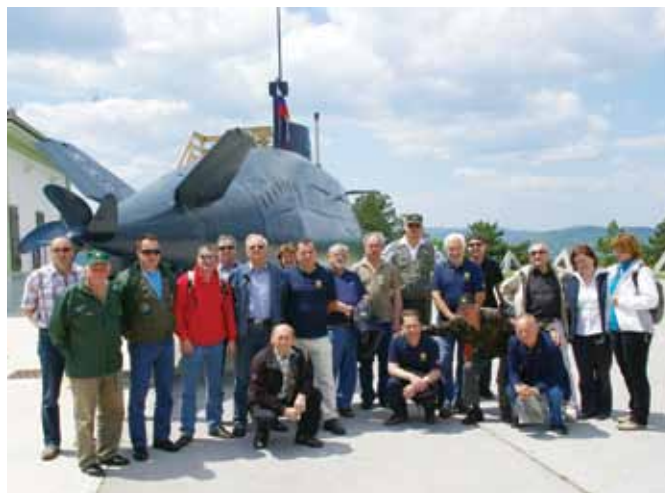
Saj bi se slikali znotraj, a kaj, ko je v njej prostora le za peščico.

Nas je najbolj zanimala podmornica P-913, ki je nastala v osemdesetih letih kot plod takratne jugoslovanske vojaške industrije. Velik delež so prispevala slovenska podjetja (železarni Ravne in Jesenice, tovarna akumulatorjev iz Mežice, Iskra, Color ...). Jugoslavija je bila med devetimi državami na svetu, ki so izdelovale podmornice.