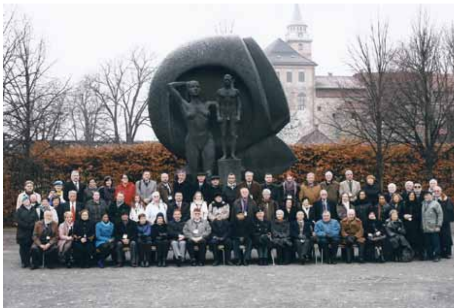
Skupinska slika vseh udeležencev srečanja

Sredi novembra 2011 je v Oslu potekalo 2. mednarodno srečanje stalnega odbora za ženske (SCOW). Srečanja sta se udeležili tudi predstavnici iz Slovenije. Namen srečanja je bil izpostaviti pomembnost zagotavljanja enakosti med spoloma in aktivne vloge žensk pri vzpostavitvi trajnega miru v državi.