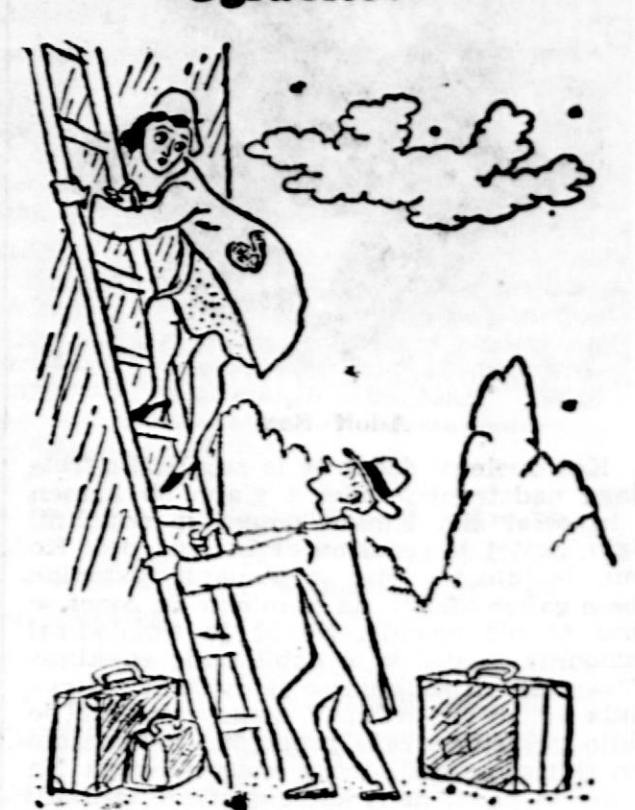
— Ne bodite nervozna, dušica, saj držim lestev spodaj. — Saj nisem nervozna. Moj očka jo krepko drži zgoraj