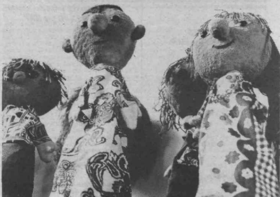
Lutkarji na O. Š. Franceta Bevka so med najaktivnejšimi. Sami izdelujejo lutke, sami igrajo in prirejajo predstave, seznanjajo se z gledališčem, učijo se igranja...