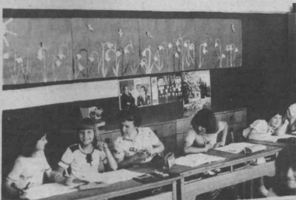
Nazornost pri pouku in izvenšolskih dejavnostih je ena od prvih zahtev sodobne šole.