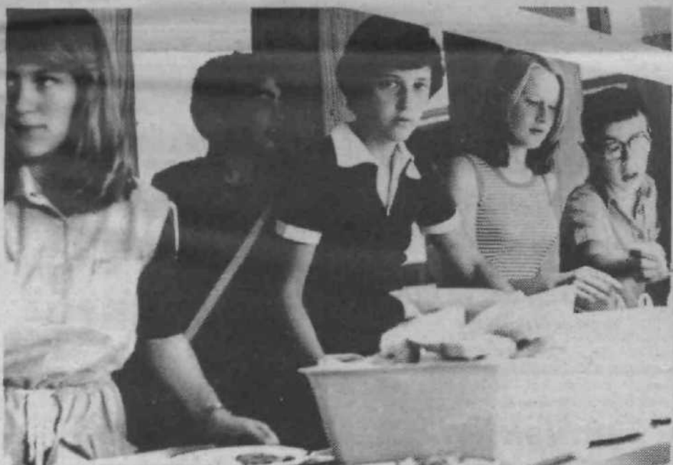
Celodnevna šola zahteva seveda tudi prehrano v šolski kuhinji. Ob našem obisku smo poanegli učence, ki v samopostrežni šolski kuhinji izbirajo to in ono za kosilo.