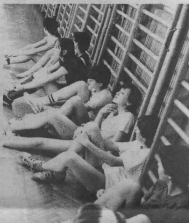
Veliko pozornost posvečajo telesni kulturi in vzdrževanju kondicije. Tako ni čudno, da mladi športniki z O. Š. Franceta Bevka pobirajo iz različnih panogah vsemogoča odličja in nagrade

Če hočemo na kratko opisati organiziranost učencev in učiteljev na O. Š. Franceta Bevka, bi se najbolje zdeli, ko bi rekli, da je to mikroorganizacija, več ali manj veren posnetek samoupravne organiziranosti naše družbe. Tako lahko naraščaj že od mladih nog v sebi razvija samoupravne in socialistične odnose. Na šoli je skupščina kot najvišje telo, ki se cepi na tri zbornice: zbor razrednih skupnosti, zbor društev in krožkov in zbor družbenopolitičnih organizacij. Zlasti slednja dva sta najbolj zanimiva. Zbor društev in krožkov obsega okoli trideset različnih krožkov in dejavnosti, in ni ga učenca, ki se ne bi udeleževal vsaj v enem. Tematsko ta zbor sistematično zajema motivacijske enote: šport in rekreacijo, kulturo, tehniko, poljudno znanje, pa še Rdeči križ, tabornike. Na šoli deluje klub mladih tehnikov, ki se pod strokovnim mentorskim vodstvom ukvar-