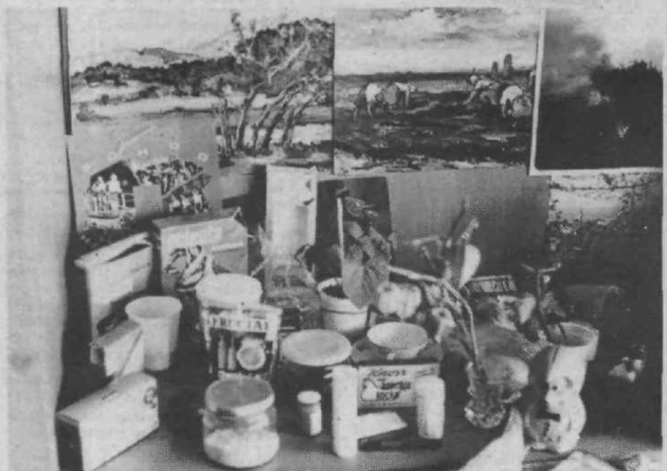
Učenci drugega razreda zbirajo vsakovrstne stvari in jih prinašajo v razred. Tako se po načinu »Pokaži in poveži« seznanjajo z otipljivo in vsakdanjo stvarnostjo.