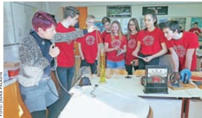
Zanimivo in zabavno je bilo tudi v fizikalni učilnici.