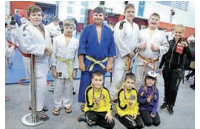
Komendski judoisti z medaljami