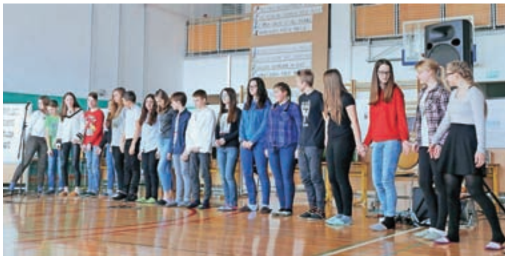
Sodelujoči na šolski prireditvi ob kulturnem prazniku

Z medpredmetnim povezovanjem slovenščine, zgodovine, etike in državljanske vzgoje ter likovnega pouka so osmošolci Osnovne šole Stranje v počastitev kulturnega praznika izdelali odlične plakate.