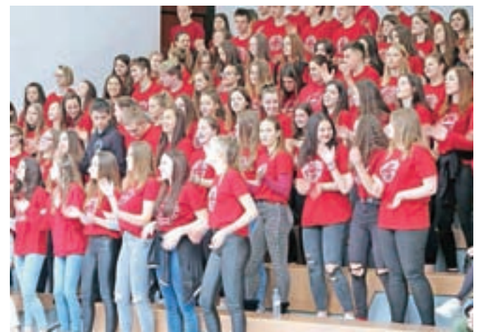
Dijaki prvih letnikov so za dobrodoščilo obiskovalcem informativnega dneva zapeli šolsko himno.

23.702 (lani 23.644) vpisni mesti v srednjih šolah. Zadnji rok za oddajo prijavnice za vpis v prvi letnik srednjih šol za šolsko leto 2019/2020 je 2. april.