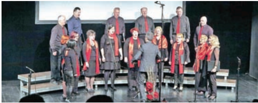
Mešani pevski zbor Mavrica Srednja vas

Strokovni spremljevalec prireditve in ocenjevalec je bil Primož Malavašič, najbolje ocenjeni zbori pa se bodo predstavili na regijski (in v nadaljevanju morda tudi na državnih) ravni.