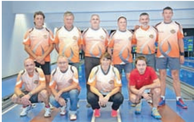
Ekipa ŠD Policist

V 13. kolu občinske kegljaške lige sta se pomerili vodilni ekipi v ligi – Ambrož Team in ŠD Soteska.