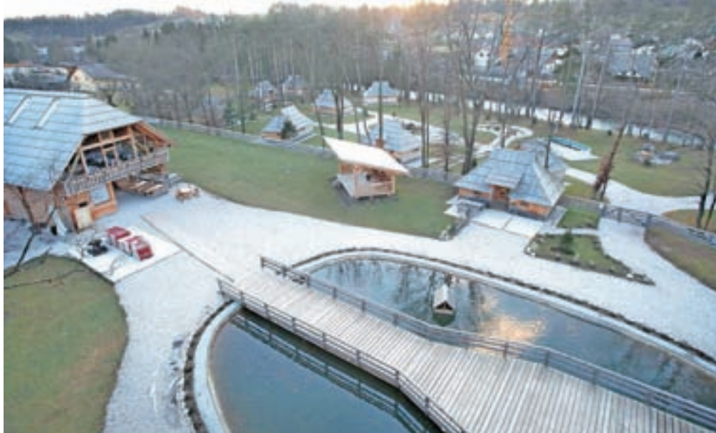
Slovenia Eco resort v Godiču

»Vloga za odlog izvršbe je bila vložena v zadevi gradnje kozolca in trenutno je samo v tej zadevi o odlogu izvršitve inšpekcijskih ukrepov tudi odločeno. Podatkov o vsebini odločitve vam do vročitve sklepa ne moremo posredovati. V zadevi gradnje 19 hišic, lesene kapelice in zunanega bazena je bila v ponovljenem postopku izdana odločba, ki še ni izvršljiva, niti pravnomočna, saj je bila vložena pritožba, ki je še v reševanju pri drugostopnem organu – Ministrstvu za okolje in prostor. V zadevi gradnje devetih manjših lesenih objektov na kmetijskem zemljišču je bila izdana odločba zaradi nelegalne gradnje, s katero je bila investitorju odrejena odstranitev objektov, v zvezi z objekti pa so bile izrečene tudi prepovedi izvedbe komunalnih priključkov, uporabe oziroma opravljanja dejavnosti, prometa z njimi in sklepanja drugih pravnih poslov. Zoper odločbo je inšpekcijski zavezanec vložil pritožbo, ki je bila odstopljena drugostopnemu organu. O pritožbi še ni bilo odločeno. V zadevi gradnje opazovalnice je gradbeni inšpektor po zaključnem ugotovitvenem postopku 8. 10. 2018 izdal odločbo, s katero je odredil, da mora inšpekcijski zavezanec ustaviti gradnjo lesene opazovalnice trikotne oblike, locirane vzhodno od ribnika, ter da