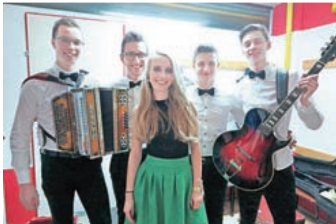
Vabilu organizatorjev za nastop na koncertu so se odzvali tudi mladi iz Ansambla Šus, ki povečini prihajajo iz Tuhinjske doline.

Koncertu, ki ga je povezovala Maja Oderlap, pa je sledila zabava s plesom do poznih nočnih ur.