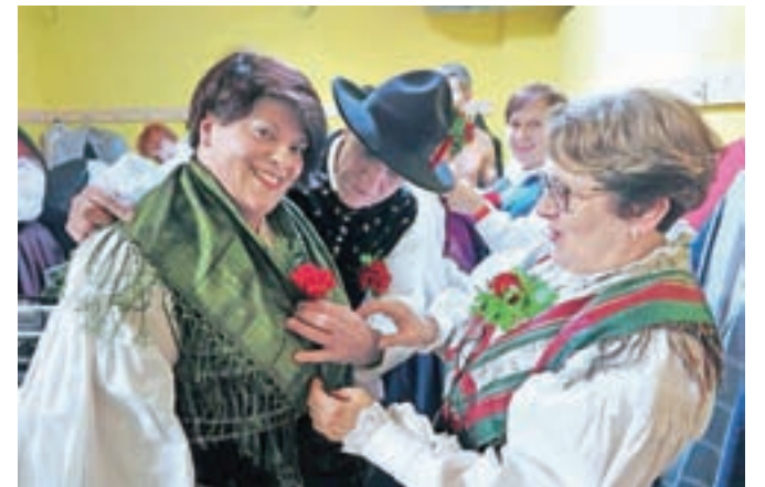
Ob poskočnih vižah so zaplesali člani Folklorne skupine Kamnik, ki smo jih takole ujeli pri zadnjih pripravah na nastop.