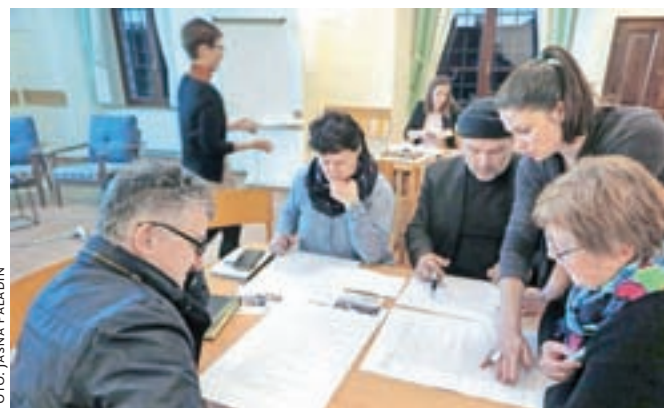
Sodelujoči na nedavni delavnici znotraj projekta CityWalk

Vse zbrano bo osnova za dokument, ki ga bodo ob koncu projekta (ta se bo zaključil maja) obravnavali tudi občinski svetniki, od katerih bo v veliki meri odvisno, ali se bodo predlogi sčasoma prijeli v praksi in bodo pogoji za pešačenje v mestu in okolici še boljše.