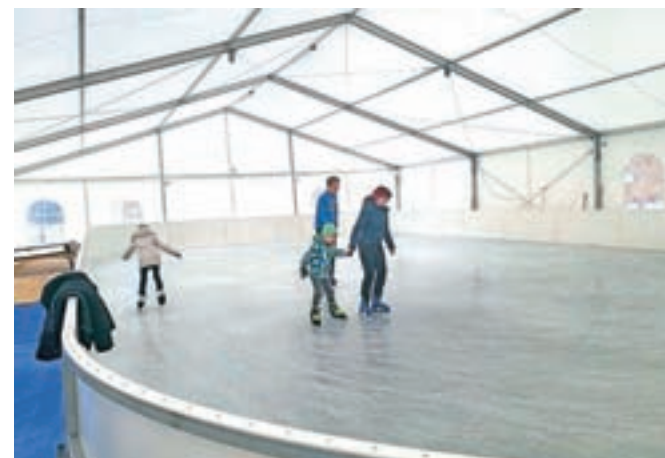
Drsališče so postavili pod večnamenskim šotorom pred Termami Snovik.

odšteti dva evra. Drsališče je odprto vsak delovnik od 16. do 19. ure, ob koncih tedna, med šolskimi počitnicami in prazniki pa od 11. do 19. ure. V tem tednu so že izvedli tečaj drsanja za otroke. Še posebej pester program v društvu obljublajo med zimskimi počitnicami. Da bo tudi pot do drsališča ekološka in v znamenju trajnosti, bodo imeli učenci kamniških osnovnih šol zagotovljen brezplačni prevoz do drsališča.