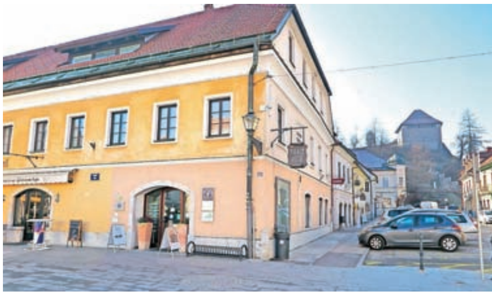
V Turistično informacijskem centru na Glavnem trgu se je število obiskovalcev septembra v primerjavi z letom poprej povečalo za petdeset odstotkov.