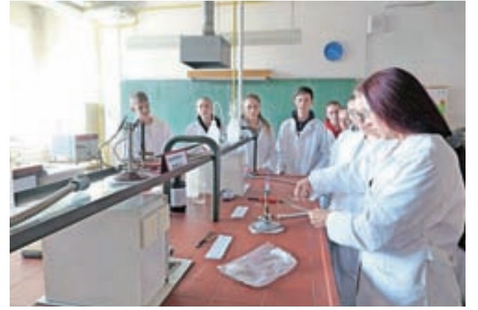
Bodočim dijakom so skušali prikazati, da je učenje kemije lahko tudi zelo zabavno.

šolsko okolje in strokovnost zaposlenih. Šola vztrajno stopa korak s časom, kar se tiče novih tehnologij, v njej pa se šolajo dijaki iz širše okolice, ne le Kamnika, celo iz Gornjega Grada in številnih drugih krajev. Osnovno šolo v letošnjem šolskem letu po podatkih ministrstva za izobraževanje, znanost in šport zaključuje 17.684 učencev (lani 17.085), ki bodo lahko kandidirali na skupno