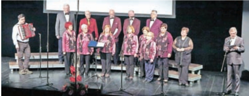
Čeprav jih je zdesetkala bolezen, so se predstavili tudi pevci Mešanega pevskega zbora DU Kamnik.

Kamnik – Zamisel za pevsko revijo odraslih zborov se je v Kamniku porodila leta 1979 ob praznovanju 750-letnice mesta in že naslednje leto so pobudo uresničili. »Sistematično ukvarjanje z zborovsko glasbo kot najbolj razširjeno obliko ljubiteljske kulturne dejavnosti v Sloveniji, v katero je vključenih več kot 60 tisoč pevcev, izhaja iz dolgoletne tradicije in tudi v našem prostoru več kot odstotek prebivalstva v obeh občinah aktivno deluje v pevskih zborih. Na javnem skladu RS za kulturne dejavnosti območno revijo organiziramo že od leta 1998 in vseskozi spodbujamo zборе, vrednotimo njihove dosežke in pripravljamo kakovostne izobraževalne programe,« je zbrane v Domu kulture Ka-