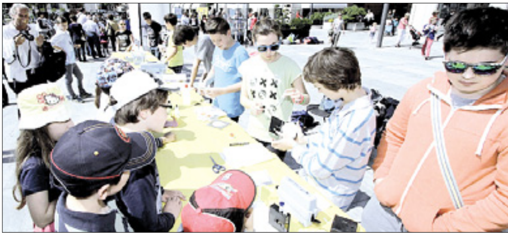
Učenci šole Ivan Trinko na festivalu znanstvene komunikacije v Trziču

Več mesecev so merili temperaturo ter si beležili pritisk, stopnjo vlage in količino padavin - Danes bo na vrsti vrtec Sonček