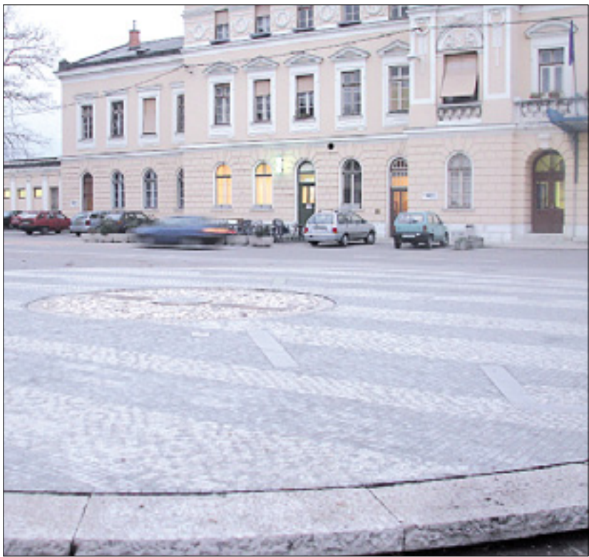
Stavba železniške postaje in Vecchietov mozaik