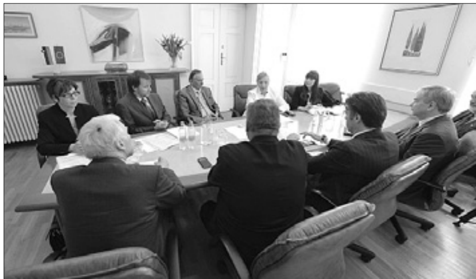
Minister Gorazd Žmavc se je sestel s predstavniki skupnega zastopstva (levo) in člani gospodarskega foruma