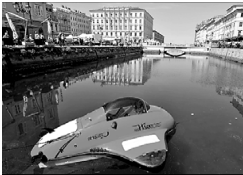
Podmornica je zaplaval po Kanalu