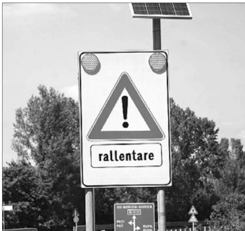
Nova opozorilna tabla z utripajočimi lučmi