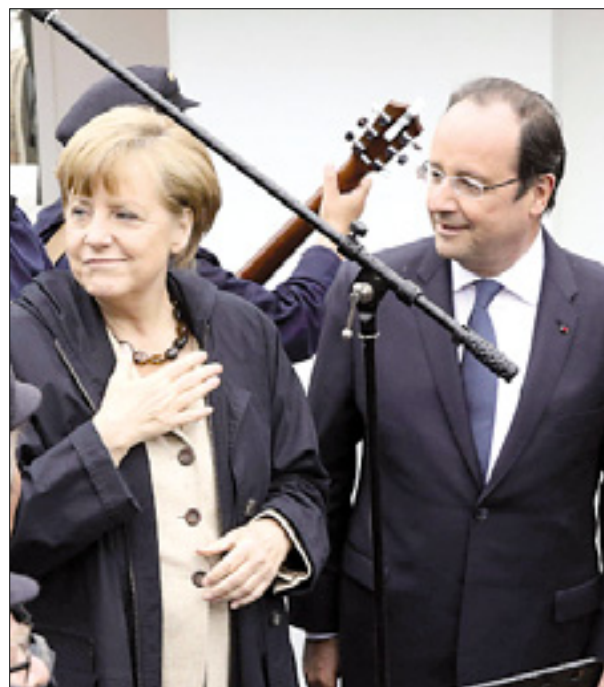
Angela Merkel in Francois Hollande

Do srečanja je sicer prišlo na simboličen datum. 9. maj je bil izbran za dan Evrope, obenem pa je to dan zmage nad nacistično Nemčijo leta 1945 in konec druge svetovne vojne v Evropi.