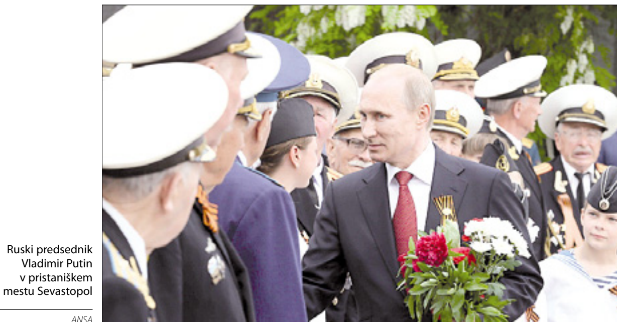
Ruski predsednik Vladimir Putin v pristaniškem mestu Sevastopol

Dan zmage pa je v pristaniškem ukrajinskem mestu Mariupol minil krvavo. Po slovesnostih ob dnevu zmage so namreč izbruhnili spopadi, ko je skupina ljudi odšla pred tamkajšnjo policijsko postajo, ki jo zasledajo proruski aktivisti in oblegajo ukrajinske sile. Ukrajinski vojniki so po neuradnih podatkih začeli streljati na skupino. Ukrajinski notranji minister Arsen Avakov je zatrdil, da je do spopadov prišlo, ko je skupina 60 "teroristov" napadla policijsko postajo. Minister je še zapisal, da je nasilje zahtevalo življenja 20 proruskih upornikov in enega policista. Po navedbah Avakova je bilo ranjenih še pet policistov, štirje uporniki pa so bili aretirani. (STA)