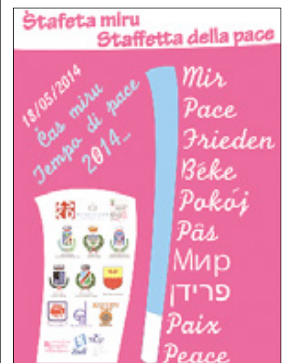
Plakat z večjezičnim pozivom k miru