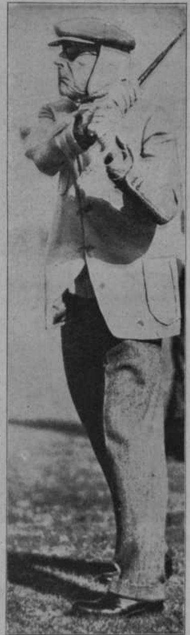
Rokefeler , najboga-tejši mož v Ameriki je star že 91 let. Pravi, da je dosegel tako visoko starost le, ker je redno živel, mnogo delal in se gibal in malo spal (po štiri do pet ur na dan). Pred nedavnim so časopisi prinesli vest, da namerava svoje ogromno premoženje razdeliti tako, da bo prišlo v prid milijonom potrebnih. Igra vsak dan igro »golf«, ki je podobna naši pastirski igri »volk«. Kljub visoki starosti se rad zabava s tem športom.