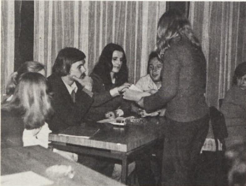
Mladinska ekipa PIONIRJA na končnem delu tekmovanja „Mladi in tradicije NOB“, ki je bilo v Tovarni zdravil KRKA. PIONIRJEVA mladinska ekipa je na tem tekmovanju osvojila 3. mesto