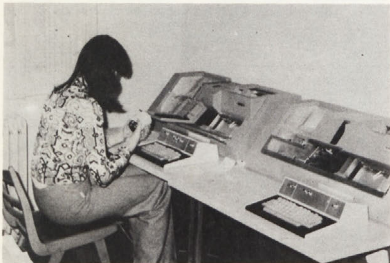
Luknjanje kartic je eno izmed pripravljanih opravil preden lahko računalnik DATA sproži svoje zapletene mehanizme in začne z delom. Na sliki je stroj, ki luknja kartice

Da ne bi hodili po slepi ulici in delali samo tisto, kar bi nam slučajno nekdo postavil na pladenj, smo imenovali komisijo, ki bo sestavila program za prihodnje leto.