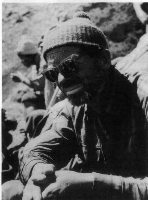
Avtor članka: heroji so utrujeni, dehidrirani in lačni, prilegla se bo dolina.