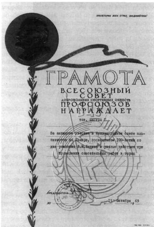
Diploma za sodelovanje na odpravi

Jutro je kot umito in brez vetra, hladno. Še preden vstanemo, se zavemo, da nas čaka negotov, težak