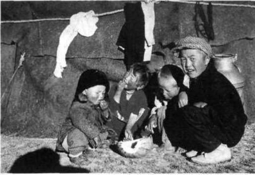
Alajska dolina: mladi rod kolhoznikov pred jurto 6. 8. 1969

Tokrat je okusna tudi večerja, na večer pa se pojavi zdaj ta, zdaj oni kolega z ognjeno vodico; dviganja čaš ni ne konca ne kraja. Italijani prinesejo čudno posodo z gorečo površino in ustniki, ki gre sprva od ust do ust, nato pa prazna roma v šotor, kamor se kmalu odpravimo tudi sami.