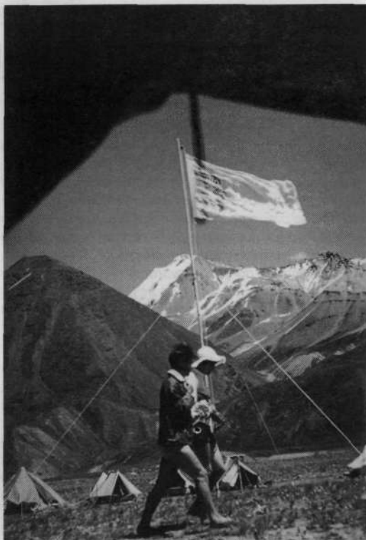
Bilo je in minilo, že jutri teh šotorov pod pamiškimi velikani ne bo več. Ačik Taš, 5. 8. 1969