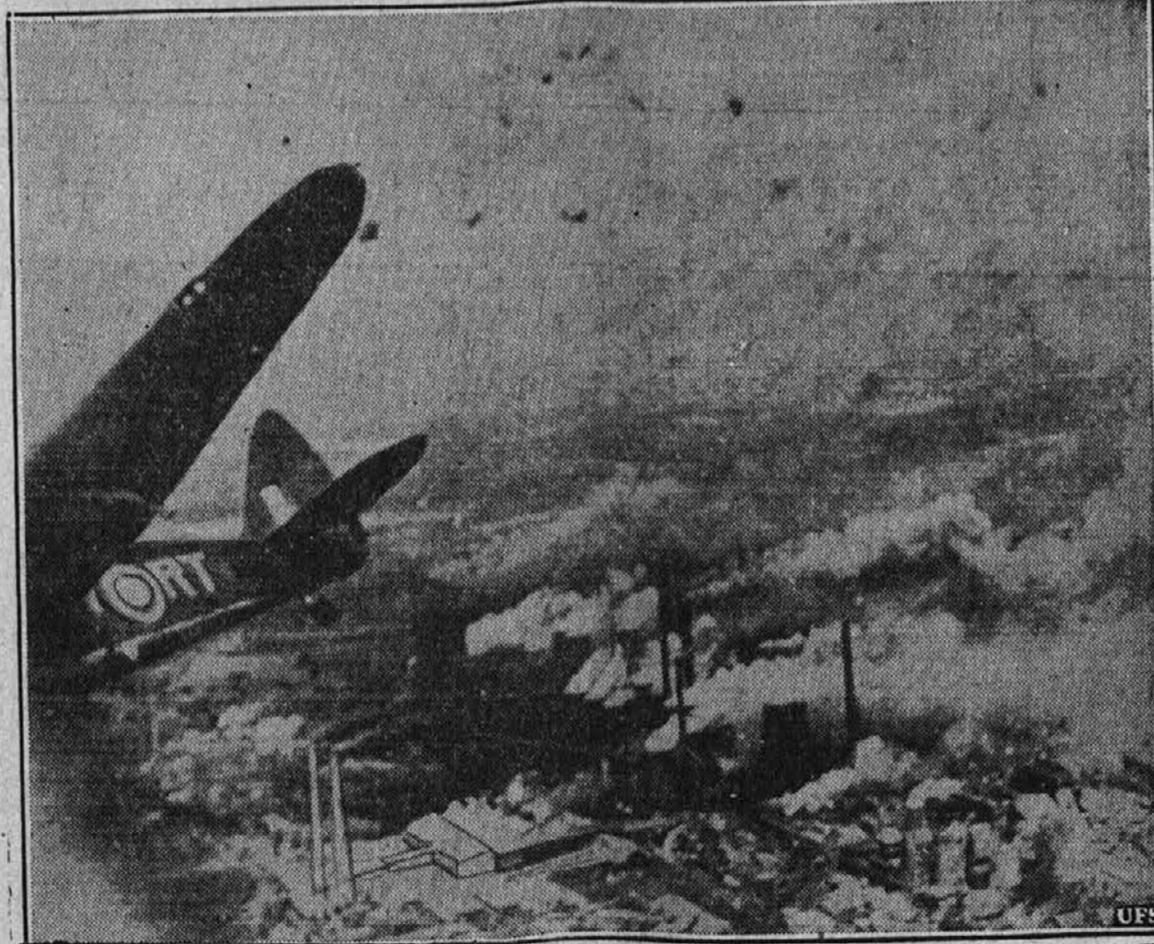
Mesto v plamenih. — Gornja slika je bila posneta iz angleškega letala potem, ko so angleški bombniki odvrgli več užigalnih bomb na industrijsko mesto Kolin v nemškem Porečju. Angliji sedaj vračajo Nemcem, kar so oni prizadejali angleškim mestom.