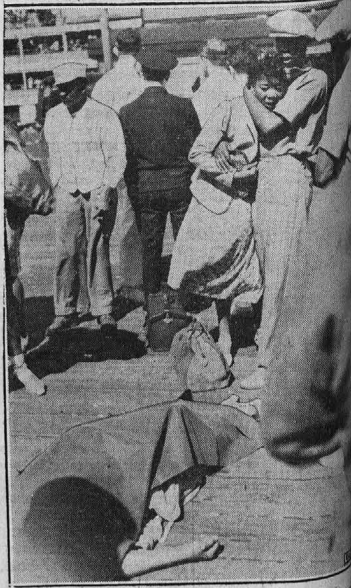
Gornja slika je bila posneta na pomolu v New Yorku, kjer je bilo zbranih okrog 5000 črncev, ki so bili namenovani na izlet z ladjo. Radi nekkih govoric je nastala med njimi panika, v kateri je bilo več izletnikov pohojenih na smrti. Gornja slika nam kaže zamorsko dekle, ki je poznala svojo mater mrtvo med žrtvami.