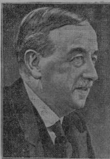
Angleški bivši zunanji minister Henderson je umrl v starosti 72 let.

srečilo nevarnost požara, ki bi bil kmalu postal za oba usodopoln, preprečiti.