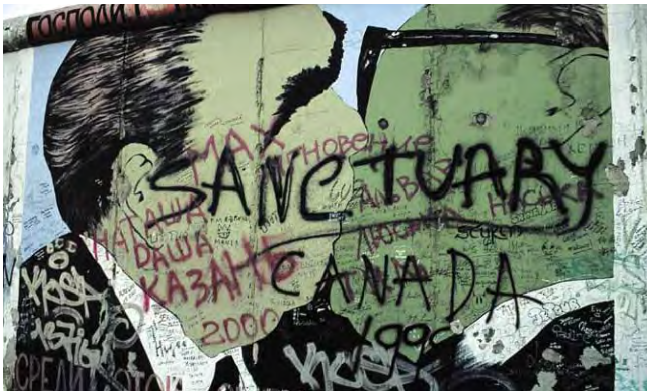
Slika 3: 1,3 km dolg ostanek zidu vzdolž reke Spree v soseski Friedrichshain, ki ga je leta 1990 poslikalo 118 umetnikov iz 21 držav, se imenuje East Side Gallery oziroma 'Galerija na vzhodni strani'. Petindvajseta slika v nizu 102 se imenuje Moj bog, pomagaj mi preživeti to smrtonosno ljubezen. Navdih zanjo je ruski slikar Dmitrij Vrubel dobil ob poljubu ruskega predsednika Leonida Brežnjeva in vzhodnonemškega predsednika Ericha Honeckerja leta 1979, ob 30-letnici obstoja Nemške demokratične republike. Sliko, ki je bila že leta 2002 precej poškodovana, so leta 2009 uničili in avtor jo je ponovno naslikal.

razvoja želela praznine čim prej zapolniti, pri tem pa ponovno vzpostaviti zgodovinski duh mesta, zabrisati sledi za zidom, a ga obenem ohraniti za ustvarjanje prepoznavne identitete mesta. Ob tem si je zadala za cilj, da s sodobnimi arhitekturnimi rešitvami ustvari mesto za tretje tisočletje.