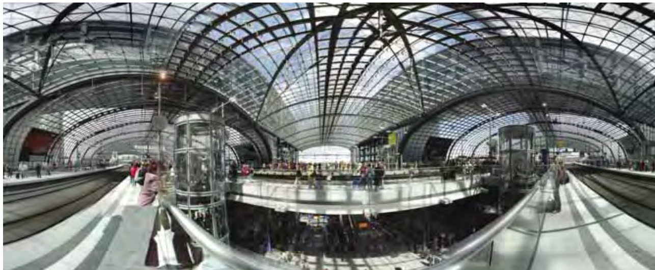
Slika 4: Najvišja raven nove Berlinske glavne železniške postaje.

drugo svetovno vojno je bila močno poškodovana. Po njej so jo za silo popravili, skoraj dokončni udarec pa ji je prizadela delitev mesta po zgraditvi zidu. Zadnji medkrajevni vlak je z nje odpeljal leta 1951. Sledilo je desetletje dolgo obdobje rušenja postajnega poslopja. Samo delno odstranjene ruševine so na nekdanjem mestu ostale vse do graditve nove postaje.