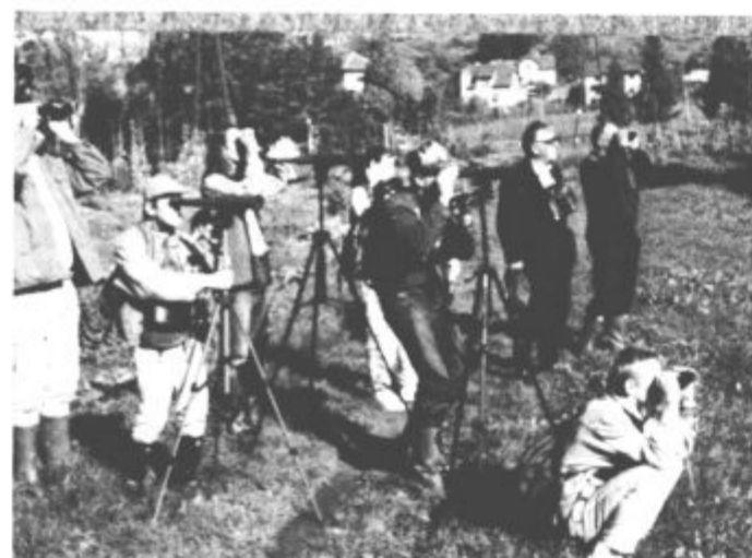
Ob jezeru je ptice lažje opazovati kot v gozdu.