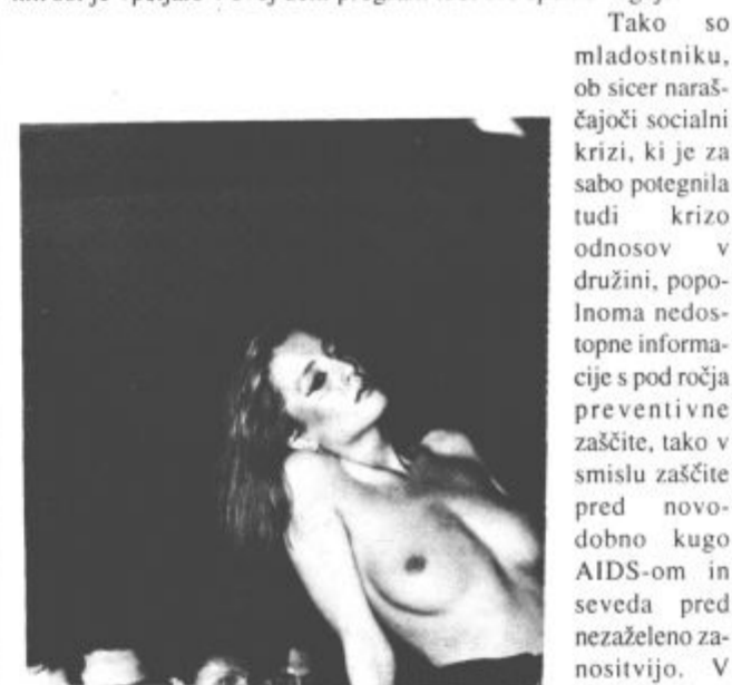
Telo ni več intima

V Sloveniji je to še dokaj močna tabu tema, kajti le malo osnovnih šol je vpeljalo v svoj učni program tudi ure spolne vzgoje.