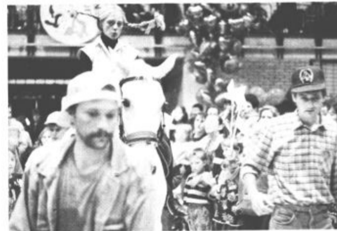
Slabi vremenski obeti so zagodili organizatorjem. Središče dogajanja Pikinega dne je bil tako namesto Pikinega trga prostor pred in v Rdeči dvorani v Velenju. Zato tudi Pikina parada ni "ubrala" velenjskih ulic, ampak se je s prostora pred Rdečo dvorano "preselila" v njeno notranjost. Na njenem čelu so bile mžazuretko. Spremljala jih je godba na pihala iz Radeč