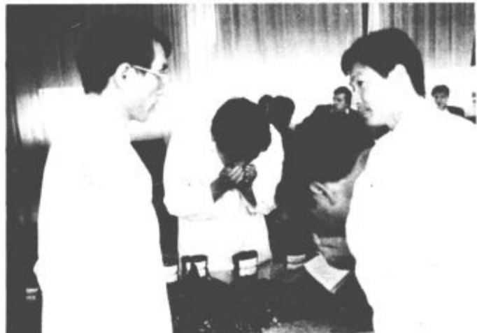
Med pregledom vzorcev hmelja letnik 1993