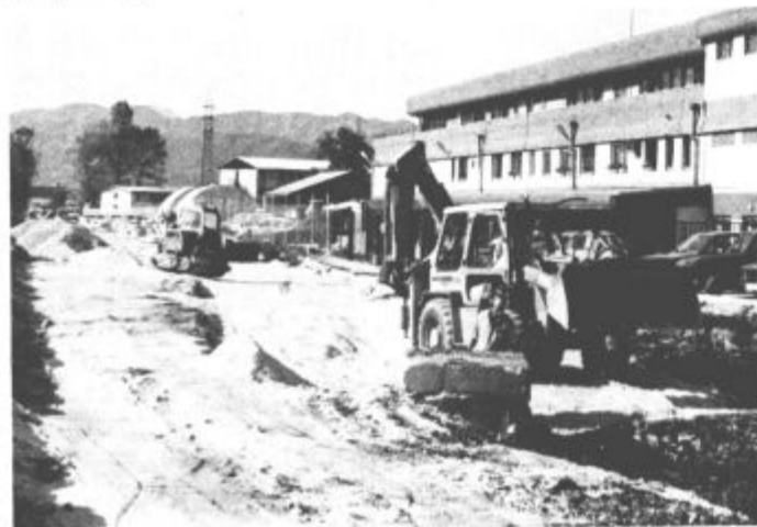
Cesta in križišči naj bi bili končani do 30. oktobra