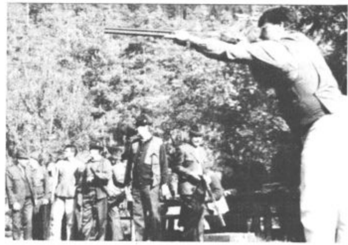
Pomeri in ustrell

Tekmovanje je vodil Milan Pokorny, ki je med drugim povedal: "Letošnjega tekmovanja so se udeležile lovske družine Velenje, Smrekovec iz Šoštanja in Oljka iz