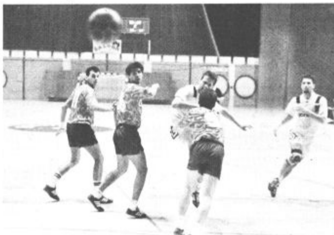
Reprezentantu Borutu Plaskanu premalo uporabnih žog

Ljubenci so gostovali v Zrečah pri favoriziranih domačinih in nesrečno izgubili. Nesrečno zaradi sodnika, ki je tekmo "vlekel" tako dolgo, da so domačini le dosegli zmagovalni zadetek. Bilo je to v 95.minuti po prekršku nad gostujočim vratarjem in takoj nato je odpisal konec tekme.