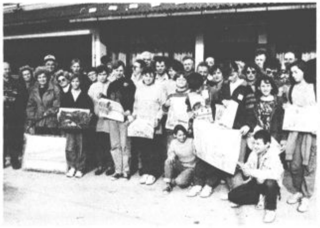
Ob koncu je nastal tudi tale skupni posnetek