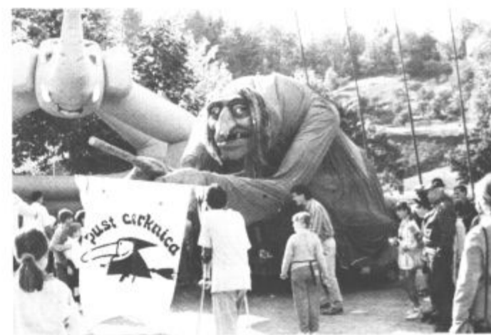
Velika cerkniška čarovnica je bila prava atrakcija ne samo za otroke, ampak tudi njihove odrasle spremljevalce