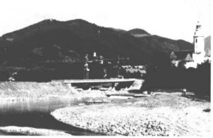
Ljubno je z obvoznico dobilo novo podobo