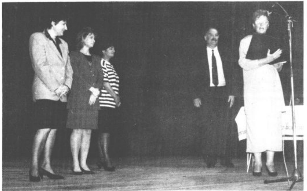
Ob prazniku krajevne skupnosti Šoštanj so podelili plakete in grbe mesta Šoštanj.

Morda prihodnje leto asfalt na cesti Penšek-Jesenek v Topolšici?