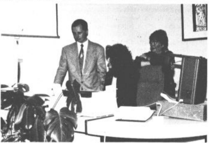
Med predstavitvijo Info Handy sistema obrtne zbornice Velenje

Zaenkrat so zbrali podatke o vseh obrtnih občine Velenje, kasneje pa bodo organizirali tudi mrežo ponudbe in povpraševanja. Neposredno se bodo lahko preko modernih pove-