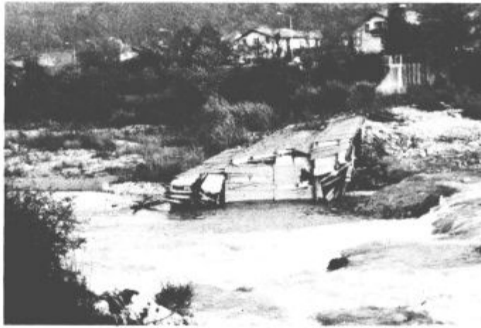
Jez v Spodnji Rečici še opominja na leto 1990

Po pomembnosti seveda tej cesti stoji ob boku urejanje Pod-