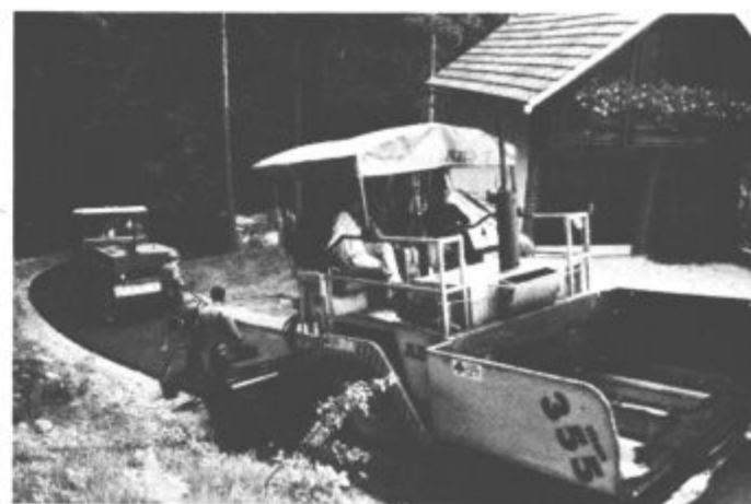
Gradbena dela so opravili delavci Cestnega podjetja Celje

bila cesta zgrajena pred praznikom občine Velenje. O gradnji nam je predsednik gradbenega