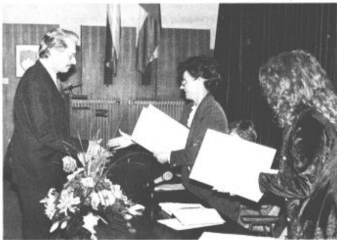
Med podelitvijo priznanj

Od 106 obrtnikov, ki jih je takrat iniciativni odbor povabil k sodelovanju, se danes velenjska Ob-