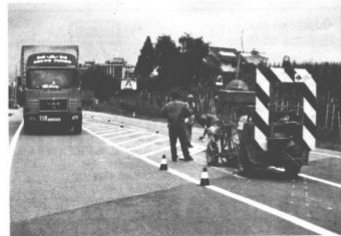
Cestarji so "poslikali" Celjsko cesto