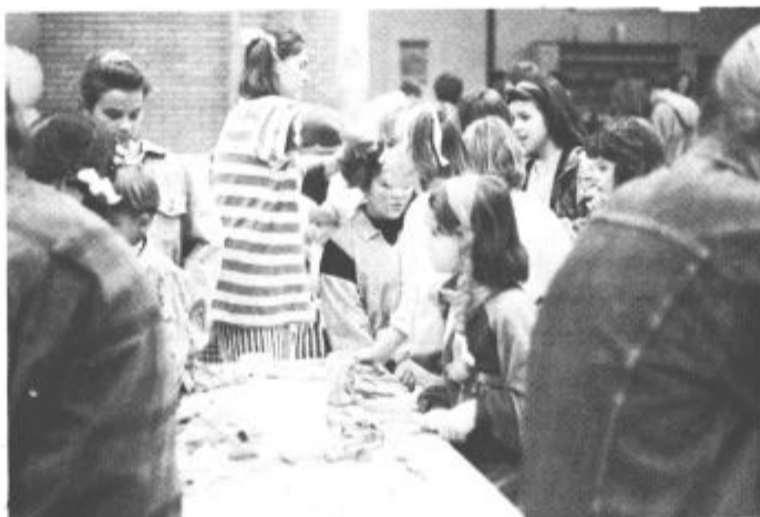
Pikina gumbošivnica, Pikina kitopletnica, Pikina silkarnica, Pikina zobopomagalka, .... Skratka, vseh 11 Pikinih delavnic je bilo dobro obiskanih

Bil je to festival v pravem pomenu besede in najbrž ne bomo udarili mimo, če ga označimo za največjo otroško zabavo v Sloveniji. Veselja, prireditve, ... je bilo na pretek. Dogajalo se je čuda in čuda stvari. Razumljivo, največ zadnji dan v soboto, ko je največja slovenska otroška zabava dosegla svoj vrhunec. Pika Nogavička je tako in tako že sama polna najrazličnejših vragolij in norčij. Če pa v goste povabi še nekaj svojih prijateljev, pa je tako oh in sploh. Teh je bilo od ponedeljka do zadnjega dne veliko. Omenimo naj Pikinega gosta