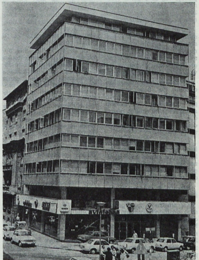
Poslovna zgrada v Beogradu

Poslovne prostorije predstavništva u Beogradu smeštene su u strogom poslovnom centru Beograda. Poslovni prostor je kupljen od strane preduzeća 1968 godine u površini od 604 m 2 . Zgradu je projektovao preduzeće »Arhitektura i Urbanizam« iz Beograda a izvođač je bilo građevinsko preduzeće »Neimar« iz Beograda. Fasada zgrade je moderna i izvanredno se uklapa u okolni ambijent.