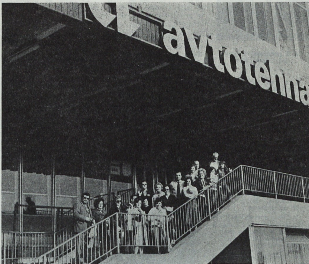
Zbrali smo se pred dvorano Tivoli

Ena od ekip našega podjetja — delavci zaposleni na Titovi 36, ki so se udeležili pohoda na 5 km, je štela 19 članov, katerim pa lahko prištejemo še 5 njihovih otrok, tako da je celotna ekipa štela 24 članov.