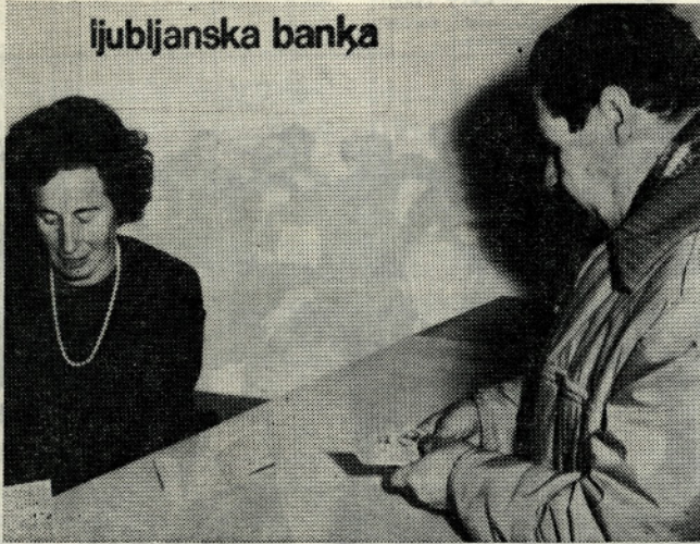
Izpostava Ljubljanske banke v obratu I

VSAK PONEDELJEK, SREDA IN PETEK: — predilnica I — od 6.00 — 7.00 ure — tkalnica I — od 7.00 — 8.30 ure