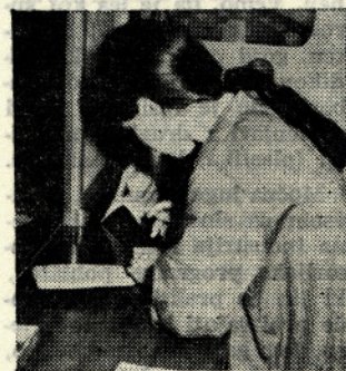
Izpostava LB — hranilna služba v obratu II