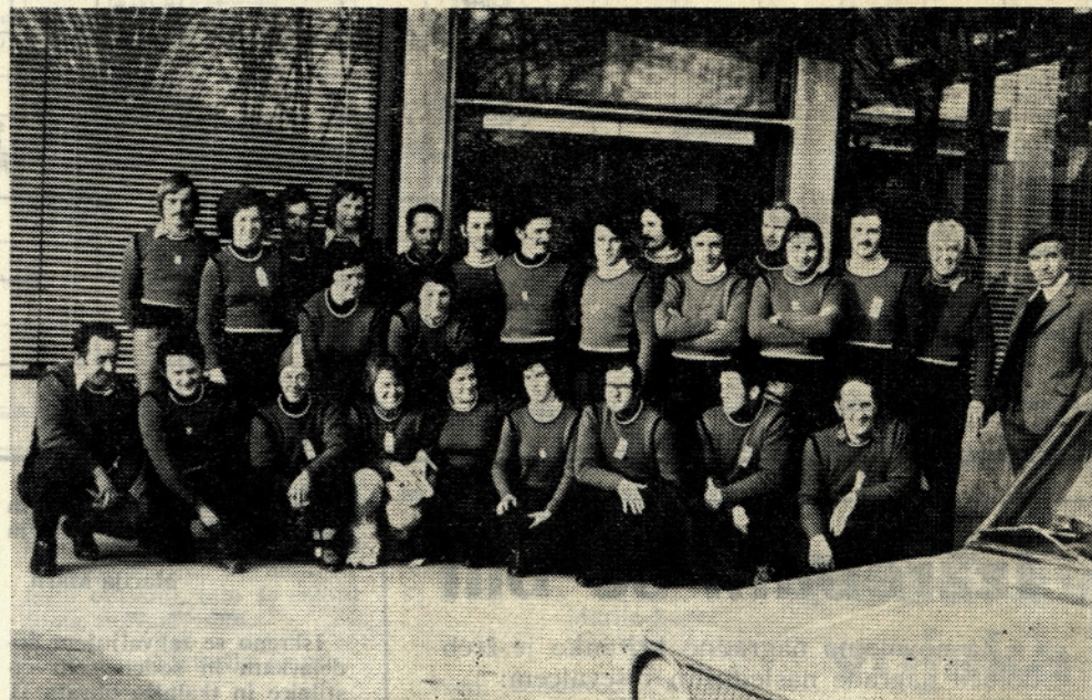
Naša ekipa, ki je zastopala barve Tekstilindusa