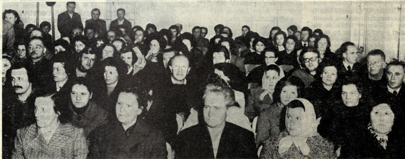
Na slavnostni seji DS na dan sprejetja ustave

Tako smo se tudi mi pridružili prazničnemu vzdušju, ki ga je bilo čutiti po vsej Jugoslaviji — dnevu, ko smo sprejeli novo ustavo. R. S.