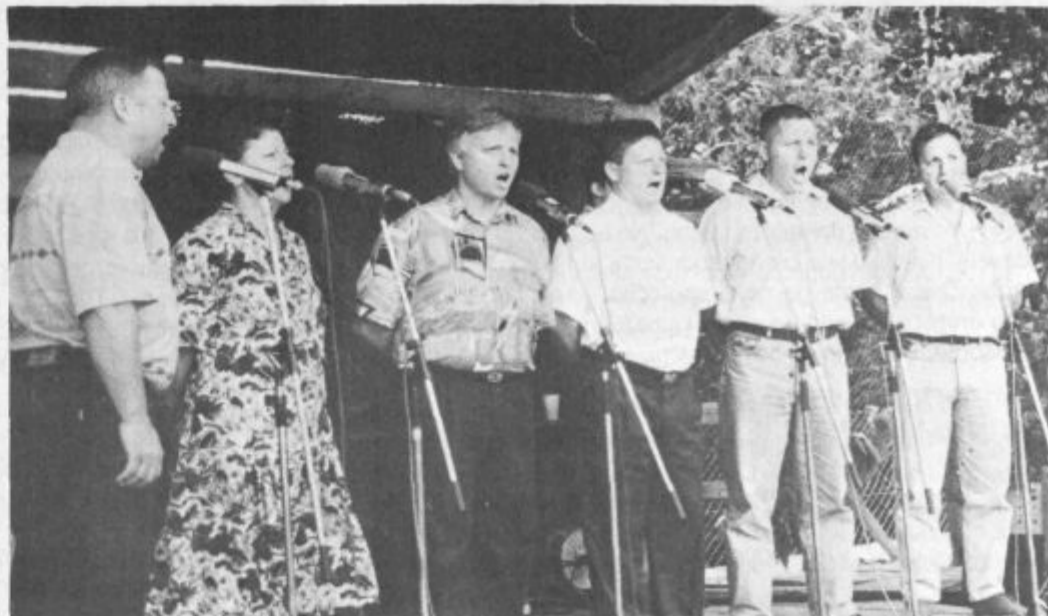
Bratje in sestre Capuder iz Lokovice so zapeli dve pesmi, in sicer Jaz pa za eno deklico vem in pesem Na Viču.