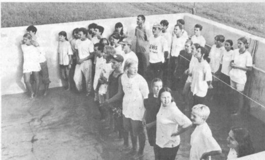
Mentorje in mlade raziskovalce, ki se prvič udeležijo tabora, je treba krstiti. Kot čakalnica na krst je prišel prav bazen pred osnovno šolo v Belih Vodah