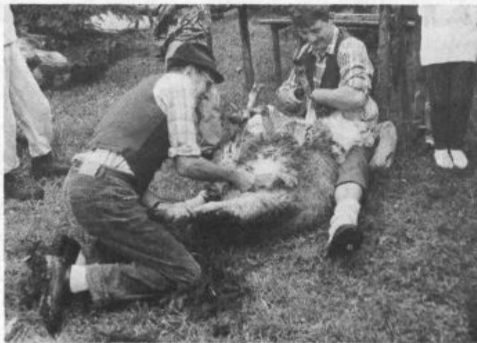
Ovcam je striženje očitno prijalo

V čudovitem šmihelskem okolju so se v prikazu ovčarskih opravil izkazali vsi domačini, od najmlajših do najstarejših, prikazali so izviren postopek od pranja ovce do striženja in predenja volne, prehrano pastirjev, njihov način življenja, gradnjo "turških ograj" na pašnikih, pripravlanje telje in še marsikaj, vse so dopolnili domači pevci, kmečke gospodinje pa so se resnično izkaza-