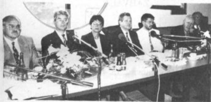
Na novinarski konferenci so predstavniki mednarodnega združenja Spar ter župan Mestne občine Celje povedali, s kakšnimi nameni so prišli v Slovenijo in kaj od sodelovanja pričakujejo

Včeraj dopoldne so v Celju odprli drugi Interspar center v Sloveniji. Novega, velikega nakupovalnega centra bodo kupci gotovo veselili, saj bodo na 14 tisoč kvadratnih metrih lahko izbirali med 100 tisoč izdelki različnih vrst, od hrane do tehničnega blaga, cene pa naj bi bile konkurenčne. Največja med trgovinami je Intersparova s prodajno površino 4270 kvadratnih metrov, v "nakupovalni ulici" v Centru pa je še 22 lokalov. Kupcem bo na voljo 620 parkirnih mest, tu pa bo našlo zaposlitev tudi 200 delavcev iz širše celjske regije. Objekt je gradil velenjski Vegrad, samo gradbena dela pa so veljala 2,3 milijarde tolarjev. Investitorji Centra Interspar v Celju so Allbet Salzburg, Euromarkt Salzburg, BTC Shopping Center Ljubljana in Poslovni sistem Mercator iz Ljubljane.