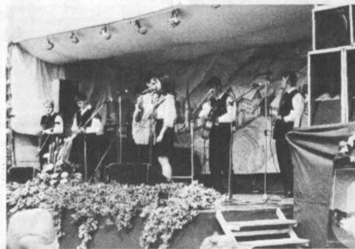
Predstavilo se je deset ansamblov, nekateri že stari znanci Graške gore.