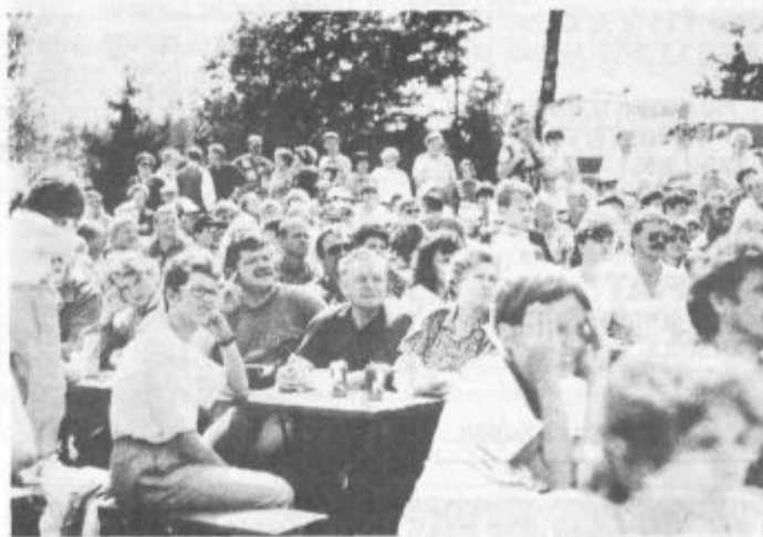
Graška gora je privabila mnoge ljubitelje domače narodne glasbe.

Organizatorji 20. jubilejnega srečanja ansamblov na Graški gori, Kulturno-umetniško društvo Ivana Cankarja iz Plešivca in Radio Velenje, so si v nedeljo oddahnil. Vreme je zdržalo, čeprav so mnogi, ki so se odpravljali na Graško goro, v to dvomili in so za vsak primer pred pričetkom še poklicali na radio in spraševali, ali srečanje bo ali ne.