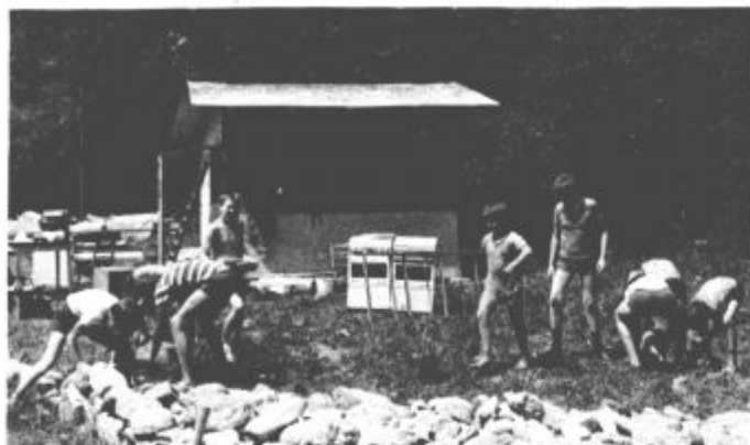
Pri urejevanju tabora in tudi drugod jim ni nič pretežko

Ne samo delovni program, tudi slovesnost ob 30. letnici slovenske taborniške organizacije bo ostala v spominu marsikateremu udeležencu osmega zleta v Ilirski Bistrici. Taborniki Slovenije so delili predsedniku Slovenije SFRJ in prvemu predsedniku jugoslovanskih tabornikov Sergeju Kraigherju na slovesnosti 5. julija, zlati znak ZTJ.