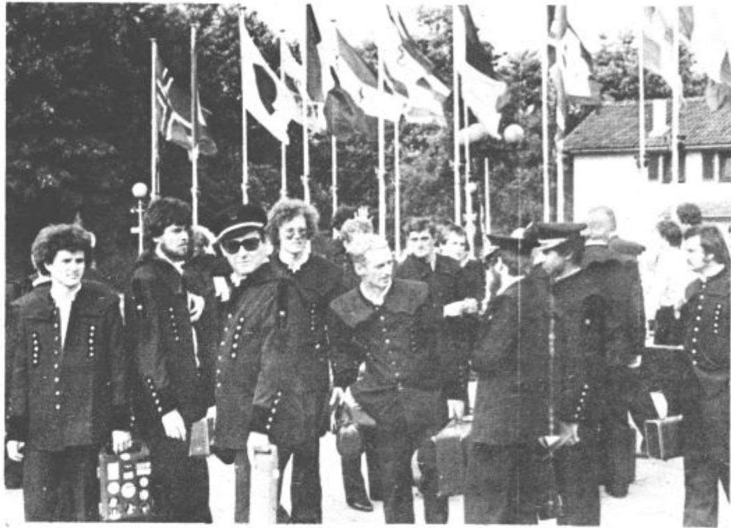
6. Pred začetkom