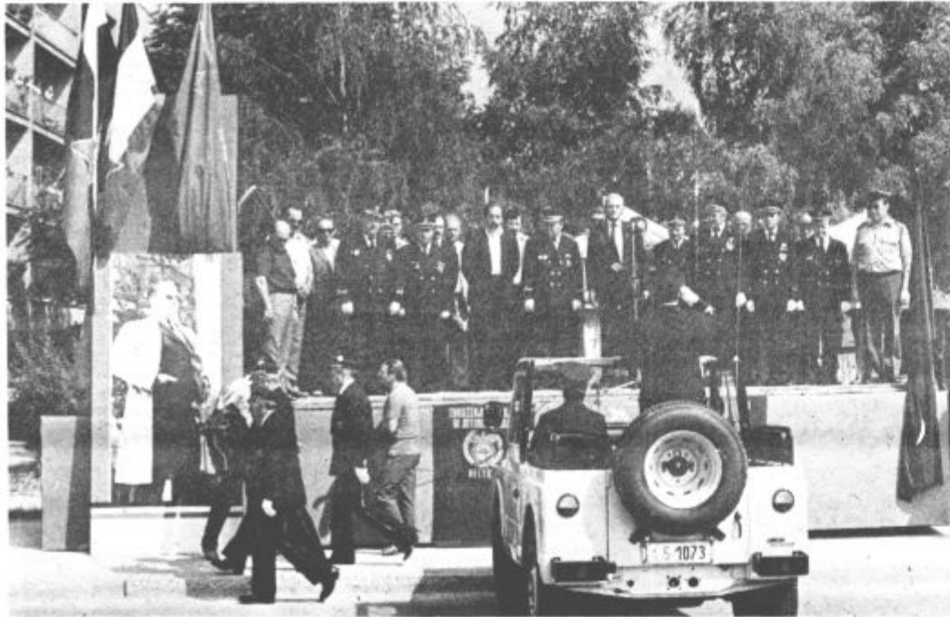
1. Po pozdravu častnim gostom so odnesli venec k spomeniku maršala Tita

Med člani društva šoferjev in avtomehanicov