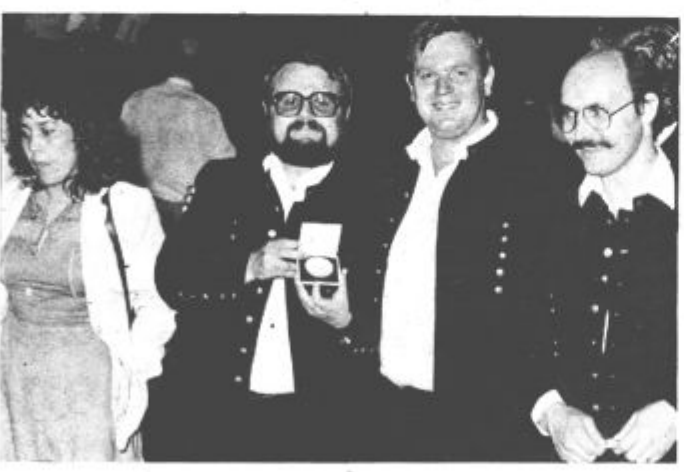
5. Veselje po prejeti medalji