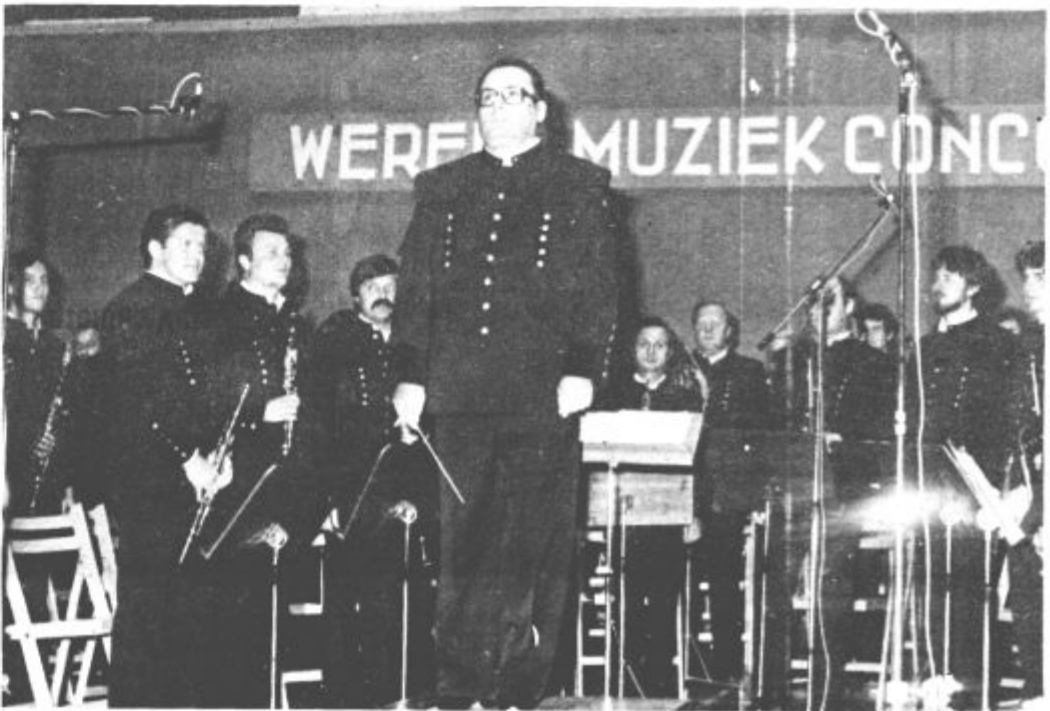
3. Samo nekaj za tem so zaigrali tako kot smo vsi želeli