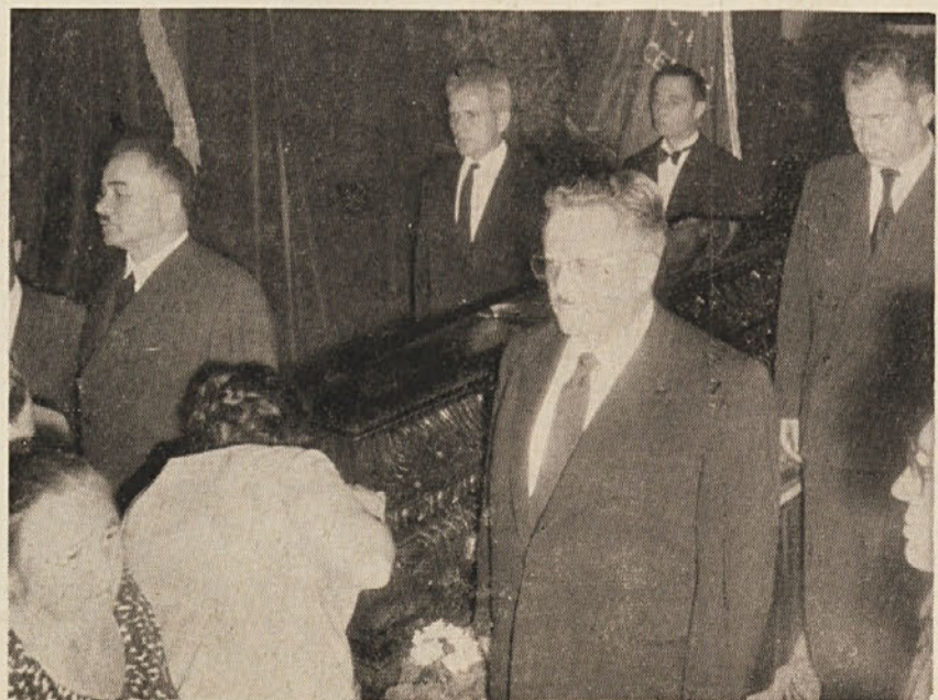
Delegacija ZK Jugoslavije na častni straži ob Togliattijevi krsti