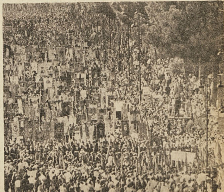
Delni pogled na množico, ki se je udeležila Togliattijevega pogreba

bi jo sklicali v najkrajšem času, obsodili kitajske voditelje in da bi ta obsodba morala veljati za (Nadaljevanje na 4. strani)