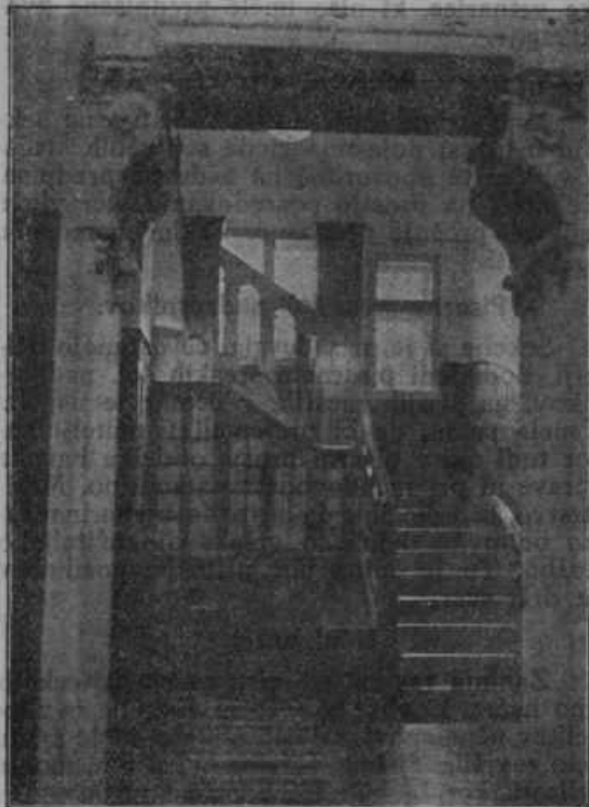
Stopnišče v dom.

Mariborski učiteljski dnevi so zlati listi v naših spominih, mariborski učiteljski dnevi naj bodo mejnik v delu naše organizacije,