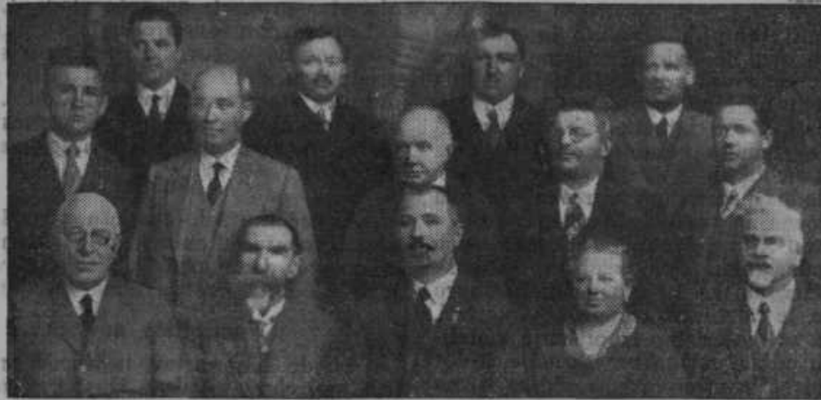
Odbor Učiteljskega doma.

In za tiste čase tako značilna salomonska rešitev: prvim so sporočili: »Najlepše je za domovino — prepevati«, drugim pa: »Najlepše je za domovino — molčati!...«