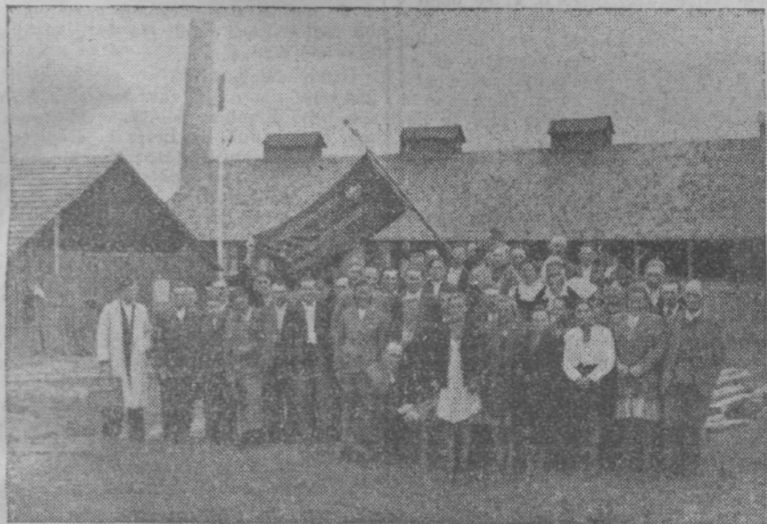
S požrtvovalnim delom pridobljena prehodna zastava

Tako pomene naše delovno ljudstvo na skromen način praznike spominu na velike moze ptujškega okraja, ki niso ugnili hrbenice narodne in razredne časti niti v času, ko je vsa Evropa ječala pod pritiskom fašističnih nasilničev.