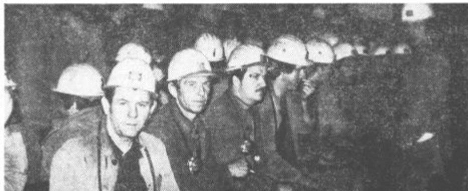
Preloge: Rudarji so prisluhnili informacijam! Prislunili in znova sklenili — trdno po Titovi poti!

★ BRATSTVO IN ENOTNOST — TEMELJ NAŠE POTI ★