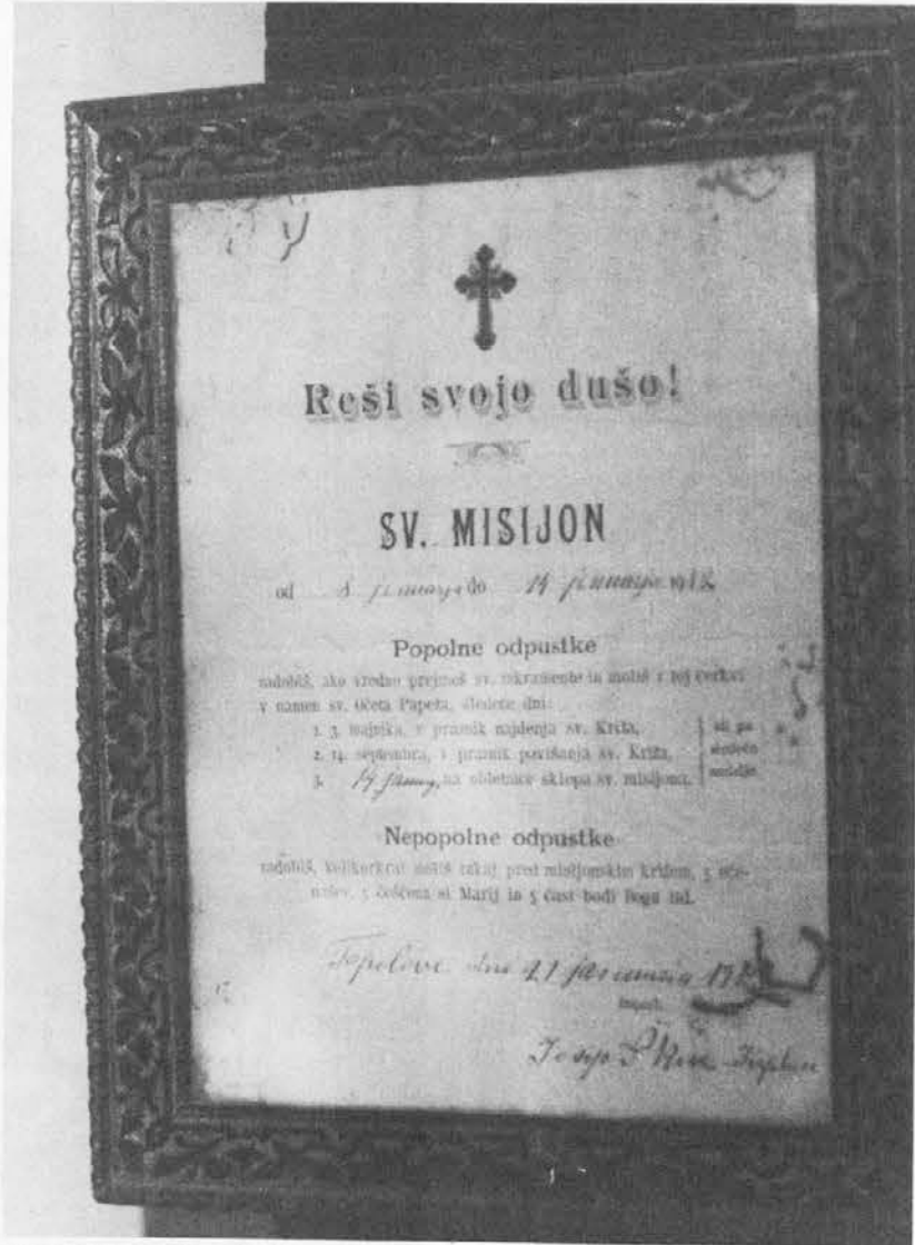
Topolovska cierku 1988

Druga resnica je, da je ries, da je komandirala DC v Garmeku 30 in v Dreki 35 let, da komandira v Sv. Lenartu in Podbonescu že nad 40 let, a dost ni mogla nardit, če je muorla