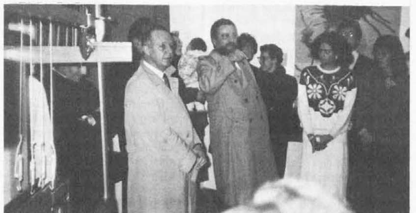
Un momento dell'inaugurazione dello studio delle due socie dell'Associazione artisti della Benecia

La valida iniziativa proposta dalle due artiste cividalesi è maggiormente valorizzata dalla loro esperienza professionale, legata a numerose rassegne, mostre ed esposizioni dove i loro manufatti sono stati ammirati ed apprezzati sia per i disegni che per il raffinato gusto cro-