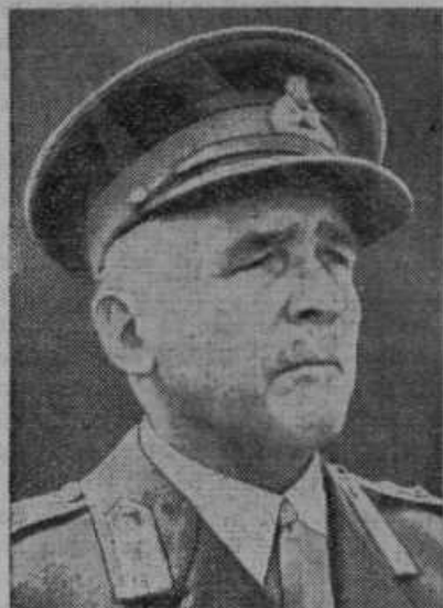
General E. Ironside, šef angleškega generalnega štaba