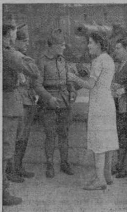
Pariska dekleta v razgovorih z na fronto odhajajočimi francoskimi vojaki