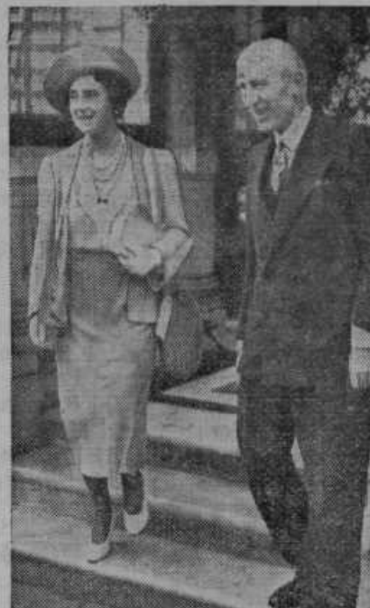
Tudi angleška kraljica ima protiplinsko masko. Nosi jo v torbici

šoferja je policija že izsledila in izročila sodišču.