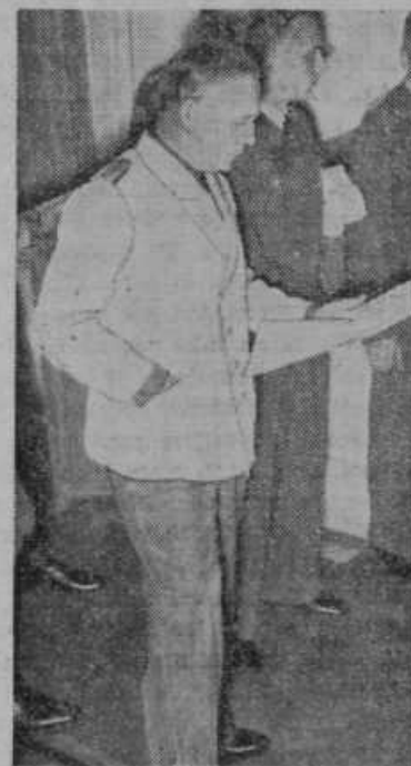
Nemški zunanji minister Ribbentrop pregleduje časniška poročila o premikanju nemških čet na Poljskem