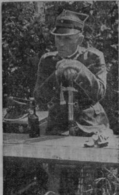
Poljski poveljnik na Westerplatti pred svobodnim mestom Gdansk, kateri je s peščico vojakov dolgo časa junaško kljuboval nemški premoči s kopnega in morja. Udal se je, ko je posadki zmanjkalo vsega: streliva, živeža in vode