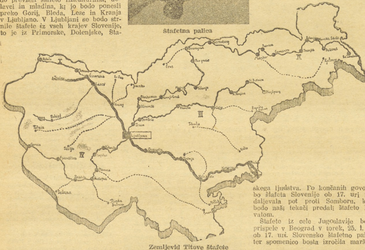
Zemljevid Titove štafete

V Sofiji je bila 12. maja odigrana prijateljska nogometna tekma med reprezentancama Praga in Sofije, ki se je končala neodločeno 2:2.