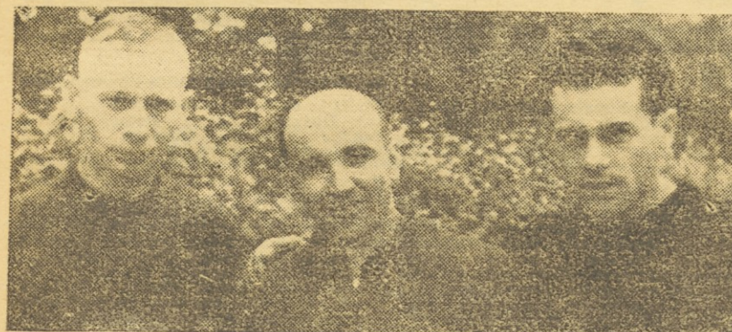
Abulnar, Valant in Bukvič

Ljubljana, 16. maja. Danes je bilo tekmovalje v cestnih kolesarskih dirkah za prvenstvo LR Slovenije. Nastopilo je 19 seniorjev in 12 juniorjev. Proga je vodila izpred Narodnega doma po Celovški cesti proti Gorenjski, zavila nato pri Brezjah na desno ter vodila po stari jeseniški cesti na Jesenice, kjer je bil pred kolodvorom obrat, nakar je vodila proga po isti poti nazaj proti Ljubljani do cilja pred Narodnim domom. Proga je merila 130 km. Juniorska proga je merila 60 km ter je vodila izpred Narodnega doma do Naklega in nazaj.