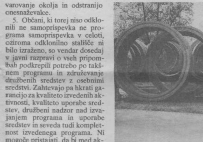
varovanje okolja in odstranilo onesnaževalce.

5. Občani, ki torej niso odklonili ne samoprispevka ne programa samoprispevka v celoti, oziroma odklonilo stališče ni bilo izraženo, so vendar dosejati v javni razpravi o vseh pripombah podkrepi potrebo po takšnem programu in združevanje družbenih sredstev za osebnimi sredstvi. Zahtevajo pa hkrati garancijo za kvaliteto izvedenih aktivnosti, kvalitetno uporabo sredstev, družbeni nadzor nad izvajanjem programa in uporabe sredstev in seveda tudi kompletnost izvedenega programa. Ni mogoče pristajati, da bi med aktivnostmi v IV. samoprispevku kakorkoli poskušali zmanjševati obseg posameznih programov.