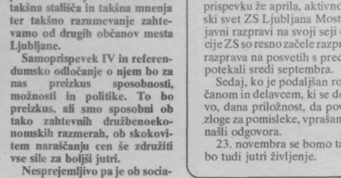
— vključijo s krediti — uspešno uresničiti.

4. Program samoprispevka IV ne more nadomestiti stalne skrbi za varovanje okolja in ne naprav za čiščenje in uvajanje boljših, kvalitetnejših tehnologij v organizacijah združenega dela, ki niso vključene v program IV. samoprispevka. Zato je toliko pomembnejša stalna skrb za varovanje okolja in dolžnost organizacij združenega dela, da v skladu s skupnimi družbenimi stališči z neposrednimi programi in plani zagotove kvalitetnejše