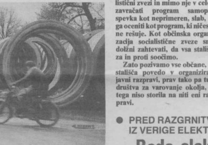
varovanje okolja in odstranilo onesnaževalce.

5. Občani, ki torej niso odklonili ne samoprispevka ne programa samoprispevka v celoti, oziroma odklonilo stališče ni bilo izraženo, so vendar dosejati v javni razpravi o vseh pripombah podkrepi potrebo po takšnem programu in združevanje družbenih sredstev za osebnimi sredstvi. Zahtevajo pa hkrati garancijo za kvaliteto izvedenih aktivnosti, kvalitetno uporabo sredstev, družbeni nadzor nad izvajanjem programa in uporabe sredstev in seveda tudi kompletnost izvedenega programa. Ni mogoče pristajati, da bi med aktivnostmi v IV. samoprispevku kakorkoli poskušali zmanjševati obseg posameznih programov.