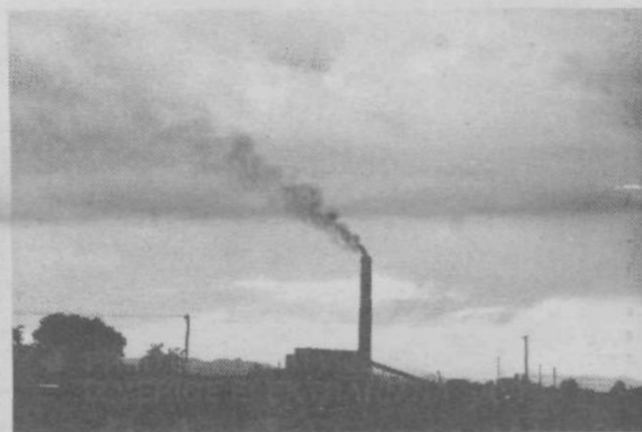
varovanje okolja in odstranilo onesnaževalce.

5. Občani, ki torej niso odklonili ne samoprispevka ne programa samoprispevka v celoti, oziroma odklonilo stališče ni bilo izraženo, so vendar dosejati v javni razpravi o vseh pripombah podkrepi potrebo po takšnem programu in združevanje družbenih sredstev za osebnimi sredstvi. Zahtevajo pa hkrati garancijo za kvaliteto izvedenih aktivnosti, kvalitetno uporabo sredstev, družbeni nadzor nad izvajanjem programa in uporabe sredstev in seveda tudi kompletnost izvedenega programa. Ni mogoče pristajati, da bi med aktivnostmi v IV. samoprispevku kakorkoli poskušali zmanjševati obseg posameznih programov.