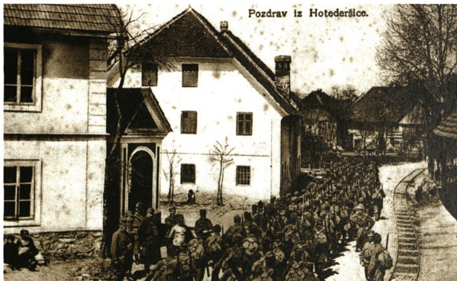
HOTEDRŠICA MED PRVO SVETOVNO VOJNO

Proti koncu 1. svetovne vojne, v zadnjih mesecih avstro-ogrske monarhije, je bila Hotedršica zaledni del Soške fronte. Od železniške proge Dunaj - Trst se je v Logatcu odcepila proti Hotedršici železnica, ki je prevažala za boj potreben material po najkrajši poti na Soško fronto. Tu je bilo skladišče vagonov, postaja za natanjanje vode in celo vojaška bolnica - lazaret. Ostanki trase te železnice, ki so jo gradili v glavnem ruski vojni ujetniki, so vidni še danes.