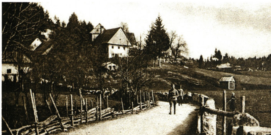
KOŠ MED PRVO SVETOVNO VOJNO

Proti koncu 1. svetovne vojne, v zadnjih mesecih avstro-ogrske monarhije, je bila Hotedršica zaledni del Soške fronte. Od železniške proge Dunaj - Trst se je v Logatcu odcepila proti Hotedršici železnica, ki je prevažala za boj potreben material po najkrajši poti na Soško fronto. Tu je bilo skladišče vagonov, postaja za natanjanje vode in celo vojaška bolnica - lazaret. Ostanki trase te železnice, ki so jo gradili v glavnem ruski vojni ujetniki, so vidni še danes.