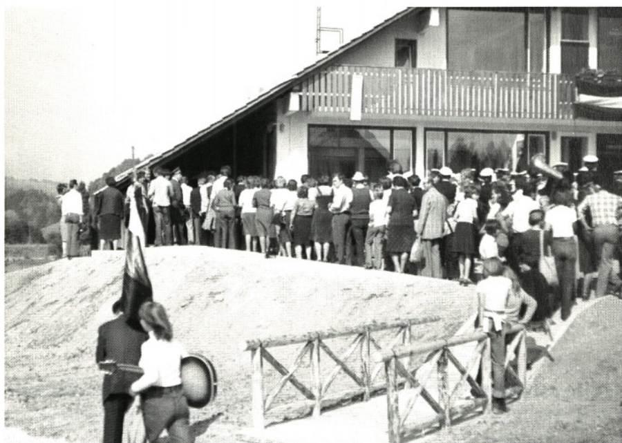
OTVORITEV NOVE ŠOLE

136 let prve šolske stavbe v Hotedršici, 20 let sedanje šolske stavbe.