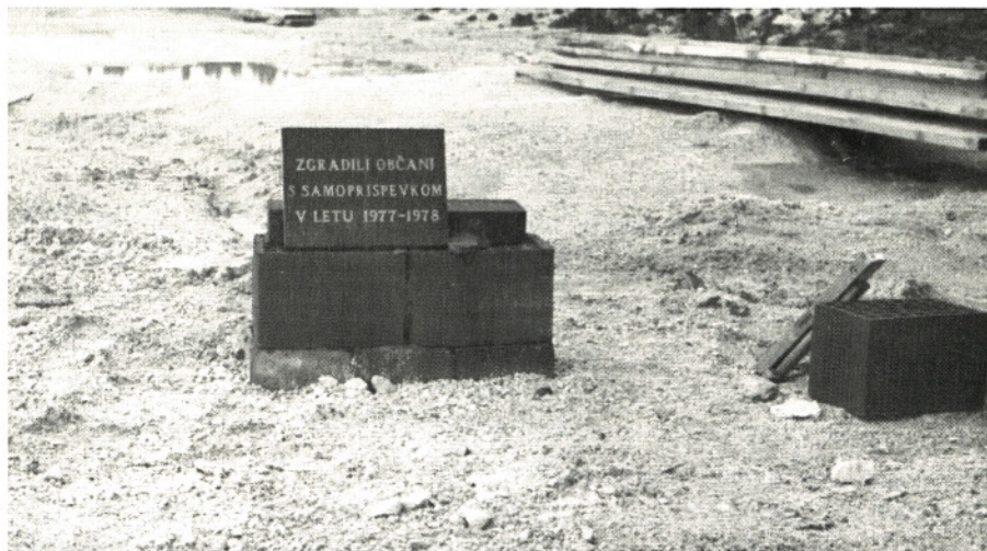
POSTAVITEV TEMELJNEGA KAMNA