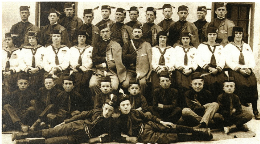
ORLI LETA 1922

Hiter razvoj kraja se je pričel po koncu prve svetovne vojne. Hotedršico so še nekaj časa zasedali Italijani, ki so se kmalu umaknili proti zahodu in ostali na robu vasi, kjer je potekala jugoslovansko - italijanska državna meja. V času med obema vojnama (okrog leta 1937) je bilo v vasi 619 prebivalcev; v takratni občini Hotedršica - brez Novega Sveta, ki je ostal pod Italijo, pa 800 prebivalcev. V vasi je bilo 5 gostiln s prenočišči, 4 trgovine, mesnica, 3 mlini ter knjižnica in čitalnica. Vas je imela tudi svoj pevski in tamburaški zbor, gasilsko društvo, lovsko družino ter Orle in Sokole.