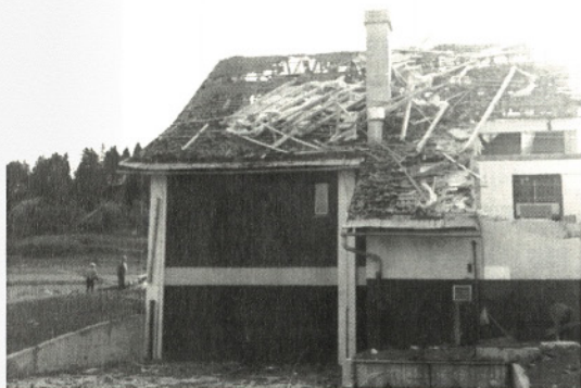
ŽALOSTEN POGLED NA ŠOLO

Strešniki in ostrejša sosednjih hiš so popolnoma uničili sprednjo stran šole. Tornado se je pomikal od Hotedršice čez Žibrše, Vrhniko do Bevk, tam pa je izgubil svojo moč. Za sabo pa je puščal podrtije in prestrašene ljudi, ki še dolgo niso verjeli svojim očem.