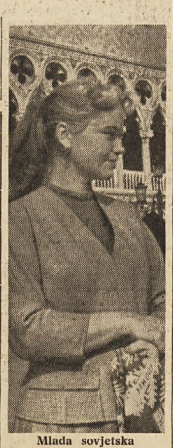
Mlada sovjetska arhitektka

Poroka in porod ne moreta biti v ZSSR vzrok odpusta žene z dela. Zakon strogo kaznuje tiste, ki bi hoteli kršiti pravice delavk, poročenih delavk in mater.