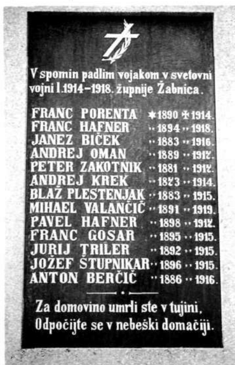
Obeležje padlim vojakom v 1. svetovni vojni v Žabnici

(Opomba: okrepljeni tisk pomeni župnije, za katere so podatki precej točni (vir: kronike, spomeniki, zapušč. spisi), navaden tisk pa ugotovitve na podlagi matičnih knjig.)