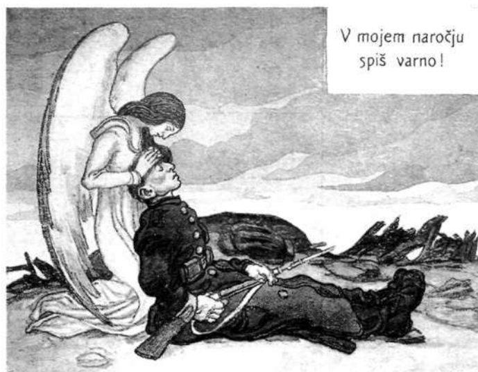
Vojaška razglednica

Leta 1916 so izšla še ena navodila za vojake: Vojak. Njegove dolžnosti in pravice. Vzroki in namen vojne . Čeprav je imela že prej omenjena močan ideološki naboj, se je druga v tem smislu posvetila vojni, vzrokom zanjo in namenu bojevanja. Proti koncu vojne, ko je želja po miru postajala vse močnejša, so začeli v vojski razširjati drugačno propagando: s predavanji so izobraževali oficirje in moštvo in sicer v narodnem jeziku. 17 Do tedaj je bil narodni jezik vojakov uporabljen le pri vojaškem bogoslužju, v armadi je bil uradni jezik nemški.