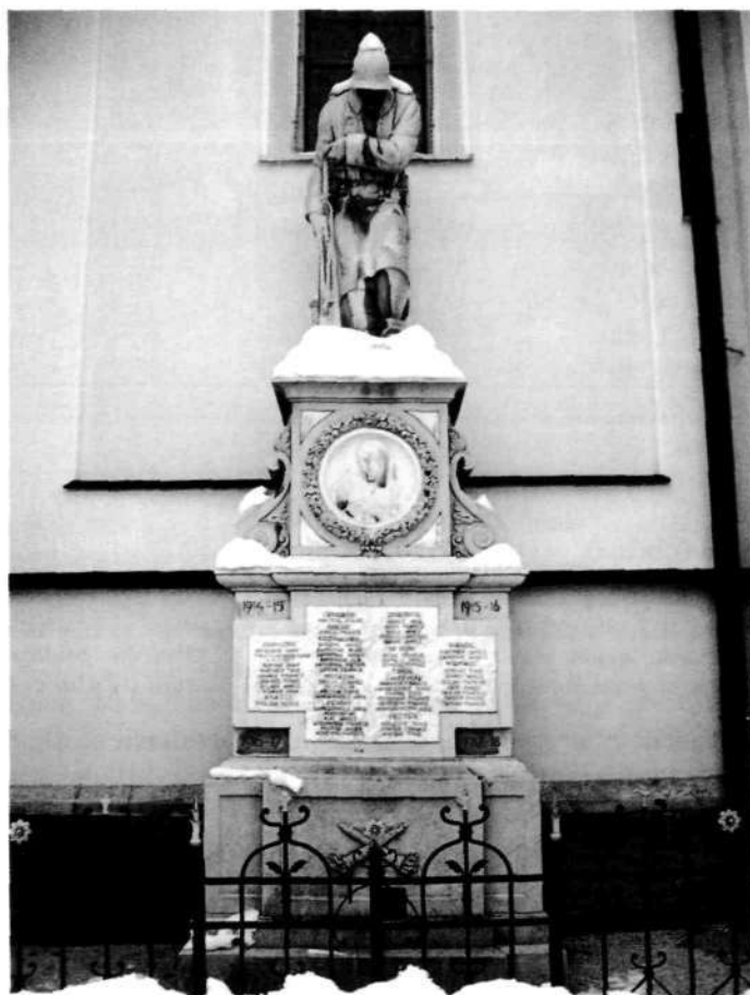
Spomenik padlim vojakom v I. svetovni vojni na pokopališču v Stari Loki

Številke o padlih in umrlih Slovenceh so bile malokdaj navedene. Samo v ljubljanskih bolnišnicah je umrlo 5.165 ranjenih vojakov, od tega 3.737 Slovencev. 49 Klavora omenja, da so imeli Slovenci (podobno kot Slovaki in Čehi) na 1000 prebi-