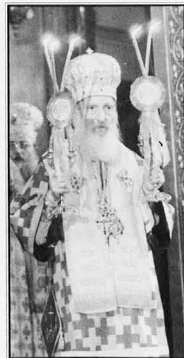
Srbskopравoslavni patriarh Pavle

Na drugi strani je OVK (Osvobodilna vojska Kosova), katere prvi in glavni politični cilj je neodvisna država. Znano pa je, da predvideva resolucija Varnostnega sveta razorožitev pripadnikov OVK in da se z razliko od dogovorov v Rambouilletu zdaj ne