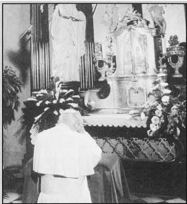
Na Slomškovem grobu v Mariboru meseca maja 1996

Predvidevajo, da bo ugledni gost omenjenega dne okoli 10. ure prispel z letalom Alitalia na mariborsko letališče. Sprejeli ga bodo najvažnejši predstavniki Cerkve in države. S svojim vozilom, t.i. papamobilom, se bo nato odpeljal k Betnavskemu gradu, kjer ga bo predvidoma pričakalo okoli 200.000 vernikov in laičnih občudovalcev njegove osebnosti in poslanstva. Okoli 11. ure se bo začela slovesna maša, med katero bo škofa Antona Martina Slomška razglasil za blaženega. Bogoslužje bo potekalo v slovenskem jeziku, pri obredu pa bo sodelovalo približno 2.800