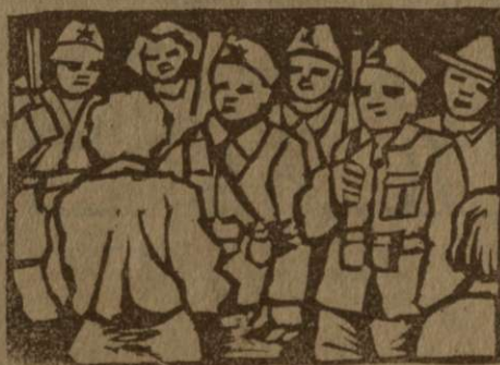
Štirji oboroženi in opremljeni pionirji, okrog njih mladina

Na prvi kongres ZSM so prišli štirje pionirji. Eden je bil star 14 let, dva sta bila po 12 let, edna pa šele 10 let. Vsi so bili opremljeni, imeli so nahrbtnike, puške, municijo in bombe. Po teh štirih pionirjih s Kočevske naj se ravnajo vsi oni, ki še niso stari 17 let, pa so dovolj močni, da bi lahko nosili puško in se borili za domovino.