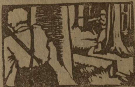
Pionir in Nemeč stojita za drevesoma in streljata drug na drugega

Na Notranjskem je srečal pionir v gozdu sovražnika. Pionir je imel pri sebi puško, ki jo je hotel nesti partizanom. Pionir skoči za drevo in ustrelj proti Nemeču. Tudi Nemeč si poišče zaklon in ustrelj.