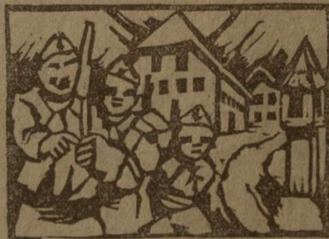
Trije pionirji na straži

da je naletel na partizane in se je hotel umakniti. Takrat ga je pa pionir ustrelil.