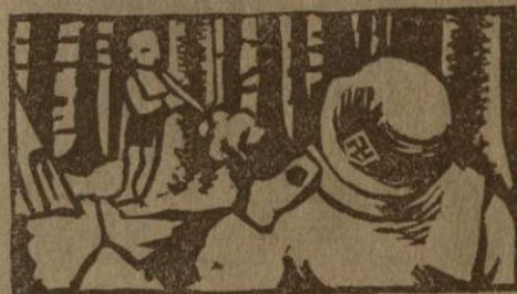
Pionir ustrelj Nemeča

Nekaj časa sta oba streljala. Nemeč misli,