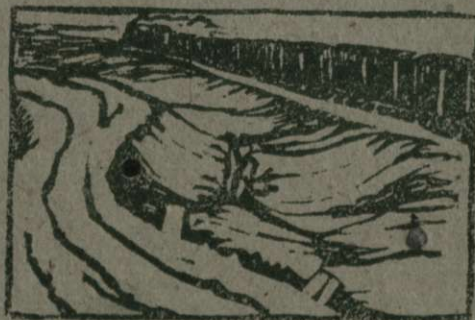
Železnica in cesta v puščini

nastala so močvirja. Vse to se je godilo desettisoč let in se še danes dogaja tam, kjer ni sovjetske oblasti. Pa tudi na drug način so se borili proti puščini. Tudi v Rusiji pred veliko revolucijo, v drugih pušnih predelih pa še danes. Mi hočemo v Sovjetski Zvezi napraviti vse puščine rodovitne, osvajalci pa se tega dela boje. Oni bočeje o prēmagati samo v toliko, da bi po