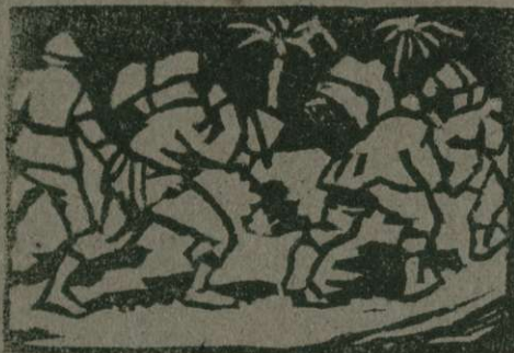
Delo v kolonijah (Plantaža)

Železnicah in cestah predril preke nje do tistih bogatih ozemelj, kjer daje narava s svojimi odprtimi rokami, do tistih ozemelj, kjer še človek ni spoznal napredka, do tistih ozemelj, ki jim pravijo kolonije. Tako grede preko pušnih osvajalci v Afriki in Aziji,