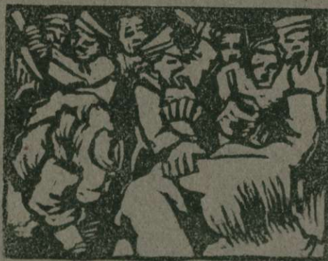
Vojaki pobijajo Kirgize

Železnicah in cestah predril preke nje do tistih bogatih ozemelj, kjer daje narava s svojimi odprtimi rokami, do tistih ozemelj, kjer še človek ni spoznal napredka, do tistih ozemelj, ki jim pravijo kolonije. Tako grede preko pušnih osvajalci v Afriki in Aziji,