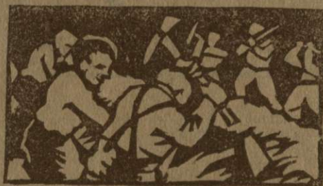
Pionirji pomagajo prekopavati cesto

Po vsej Beli krajini pomagajo tudi pionirji prekopavati ceste.